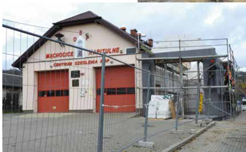
Strażnica w Mąchocicach Kapitulnych zyska dodatkowy boks garażowy, pompę ciepła oraz panele fotowoltaiczne. Budynek przejdzie również niezbędny remont.

koszt to ponad 10 mln 600 tys. zł, który pokryło dofinansowanie pozyskane z Programu Inwestycji Strategicznych Polski Ład i środki z budżetu gminy Masłów.