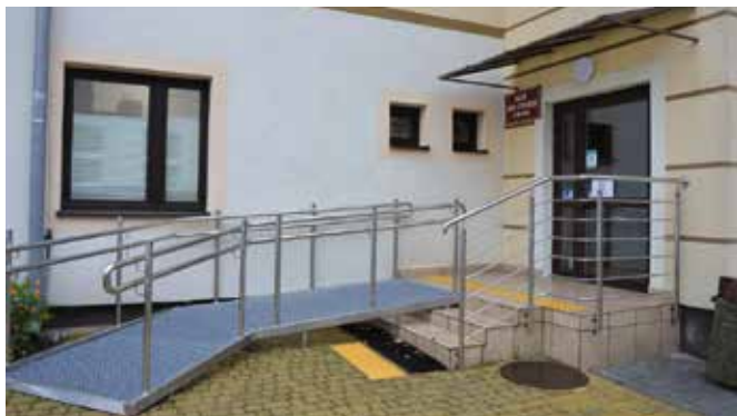
Przed urzędem wybudowano podjazd dla osób z niepełnosprawnościami.

Przy wejściach do budynku urzędu zostały zamontowane poręcze oraz tabliczki brajlowskie z informacją o jego przeznaczeniu i godzinach otwarcia. Takie tabliczki oznaczyły również pomieszczenia wewnątrz budynku, a informacje o danym piętrze umieszczone są na nakładkach na poręczach. To nie jedyne ułatwienia dla osób z wadami wzroku, bo przy wejściach pojawiły się dwa plany tyflograficzne, które zapewniają informacje o rozkładzie pomieszczeń w sposób wizualny, dotykowy oraz dźwiękowy z poddrukiem i opisem w brajlu. Udogodnienia są również dla osób z wadą słuchu, dla których ustawiono w urzędzie dwie przenośne pętle indukcyjne, umożliwiające odbiór nieskazitelnie czystego i wyraźnego dźwięku. Na poprawę bezpieczeństwa urzędu dla osób z niepełnosprawnościami mają również wpływ pasy uwagi przed schodami i taśmy kontrastowe, które sygnalizują zmiany wysokości podłoża.