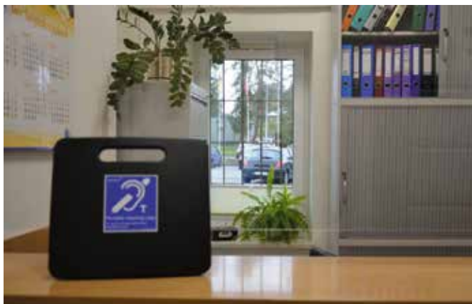
Udogodnienia są również dla osób z wadą słuchu, dla których ustawiono w urzędzie dwie przenośne pętle indukcyjne, umożliwiające odbiór nieskazitelnie czystego i wyraźnego dźwięku.