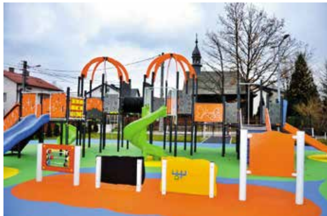
Priorytetem realizowanej inwestycji było bezpieczeństwo dzieci.

Na nowym placu zabaw znajdziemy dziewięć większych i mniejszych urządzeń zabawowych, które zabezpiecza miękka, gumowa i odporna na warunki atmosferyczne nawierzchnia. - Cieszy mnie, że mali mieszkańcy Woli Kopcowej mają nowe, bogato wyposażone miejsce do zabawy. Priorytetem realizowanej inwestycji było bezpieczeństwo dzieci, dlatego w obiekcie w którym znajdują się dość wysokie urządzenia pojawiło się bezpieczne, amortyzujące podłoże – informuje wójt Tomasz Łato .