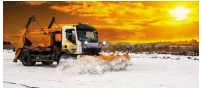
W pierwszej kolejności odśnieżane będą drogi, na których ruch jest największy oraz drogi po których poruszają się pojazdy komunikacji publicznej.

Urząd Gminy Masłów informuje mieszkańców, że kolejność odśnieżania dróg gminnych odbywa się wg ustalonych standardów. W pierwszej kolejności odśnieżane będą drogi, na których ruch jest największy oraz drogi po których poruszają się pojazdy komunikacji publicznej. Przyjmuje się, iż łączny czas jednokrotnego odśnieżania wszystkich dróg wyniesie ok. 6 godz. Prosimy, zatem mieszkańców o cierpliwość, wyrozumiałość i dostosowanie sposobu jazdy do warunków panujących na drogach.