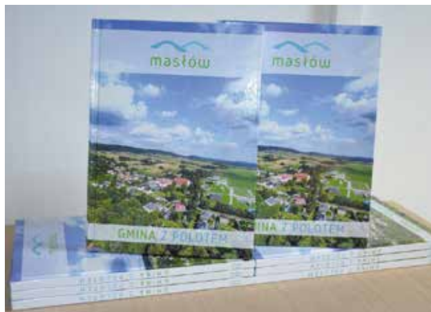
Album jest częścią dużego projektu, który realizuje gmina Masłów we współpracy z Lokalną Grupą Działania Wokół Łysej Góry.

- Album jest częścią dużego projektu, który realizuje gmina Masłów we współpracy z Lokalną Grupą Działania Wokół Łysej Góry. Dzięki niemu wiosną tego roku powstała już aplikacja turystyczna gminy Masłów oraz mapa turystyczna. Wkrótce na Żeromskczyźnie stanie ramka społecznościowa w formie pocztówki z Ciekot, która nie tylko znakomicie wpisze się w turystyczny charakter tego miejsca, ale z pewnością znajdzie się na wielu fotografiach zrobionych zarówno przez gości jak i mieszkańców naszej gminy. W ramach projektu w przyszłym roku ukaże się książka dla dzieci, której koszt podobnie jak pozostałych zadań pokryje unijne dofinansowanie – informuje