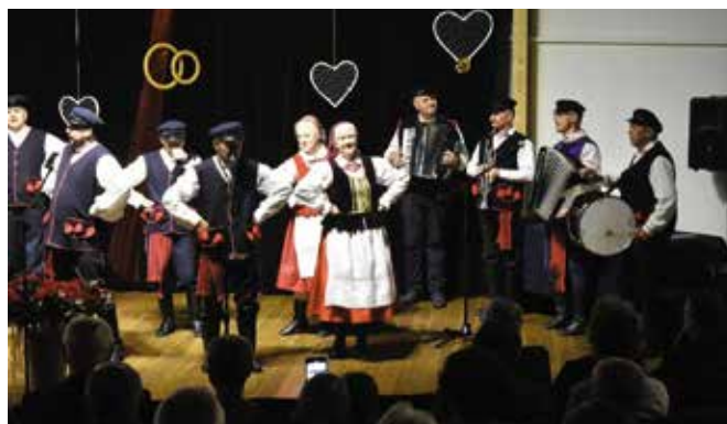
Dla wszystkich wystąpił Zespół Pieśni i Tańca Ciekoty.