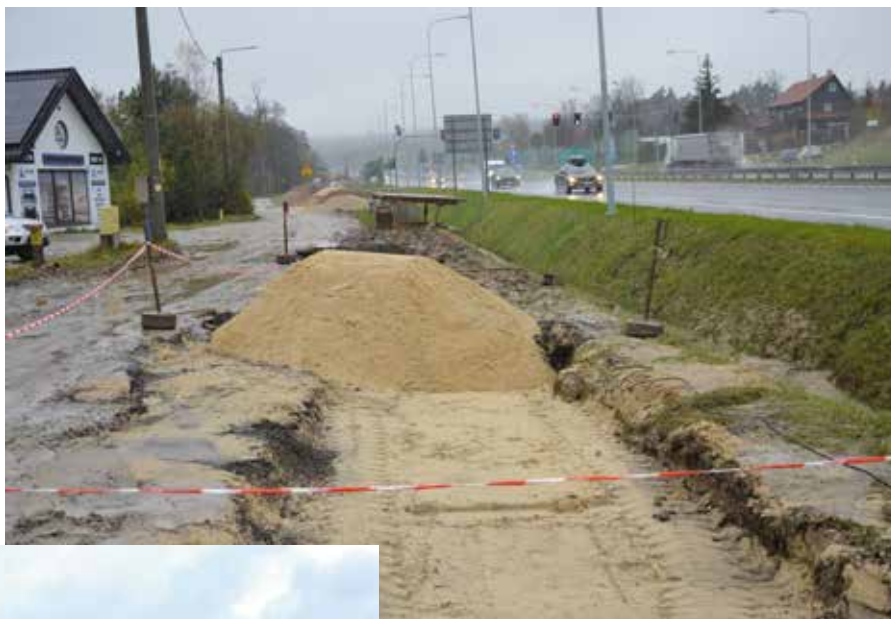
W Wiśniówce powstaje niemal dwukilometrowa sieć kanalizacji sanitarnej. Inwestycja jest realizowana z rządowym dofinansowaniem.