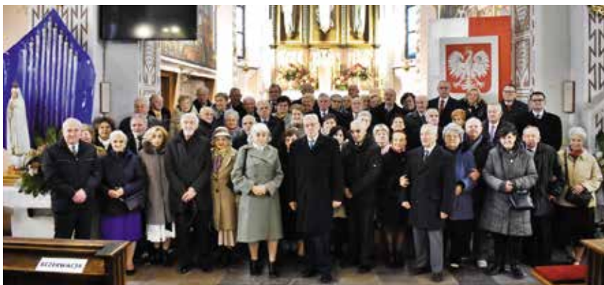
Pamiątkowe zdjęcie jubilatów przed masłowskim ołtarzem.