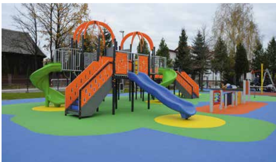
Przy szkole w Woli Kopcowej powstał nowoczesny plac zabaw. Jego bezpieczeństwo zwiększa specjalna, gumowa nawierzchnia.

i nauczyciele mają bardzo dobre warunki do nauki i pracy. Na finiszu są prace przy budowie sali gimnastycznej przy szkole w Woli Kopcowej, której realizacja jest możliwa dzięki rządowym funduszom z Polskiego Ładu. Jej sercem jest płyta bo-