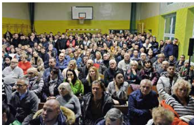
Sala gimnastyczna była wypełniona do ostatniego miejsca.