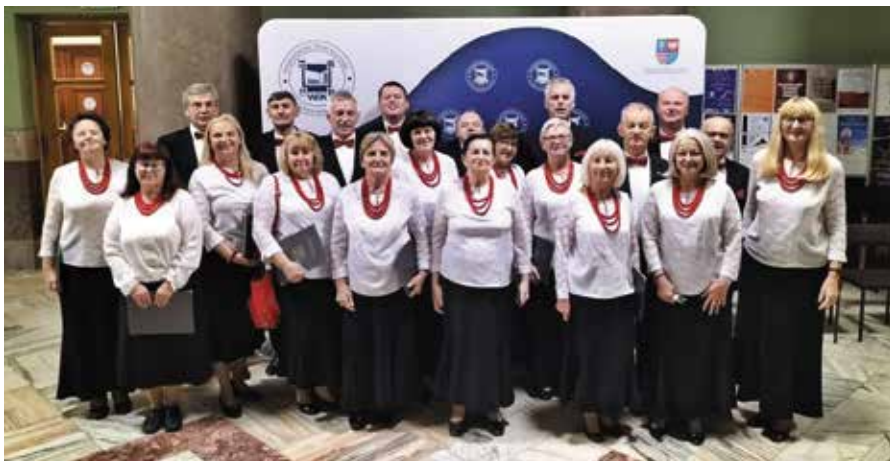
Nasi chórzyci odnieśli kolejny sukces.