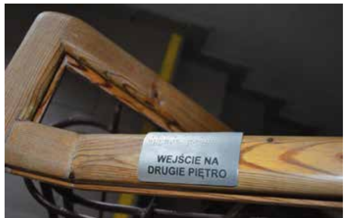
Tabliczki brajlowskie z informacją o jego przeznaczeniu i godzinach otwarcia oznaczyły również pomieszczenia wewnątrz budynku, a informacje o danym piętrze umieszczone są na nakładkach na poręczach.