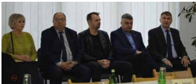
W sesji uczestniczyli również dyrektorzy szkół podstawowych z terenu gminy Masłów.