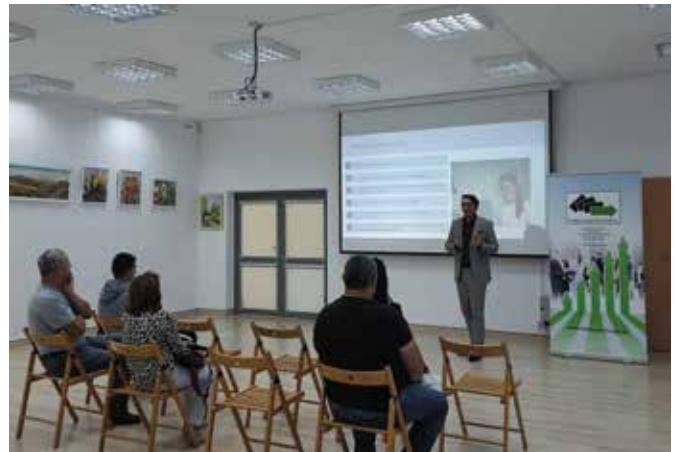
Spotkania prowadzili pracownicy Powiatowego Urzędu Pracy.