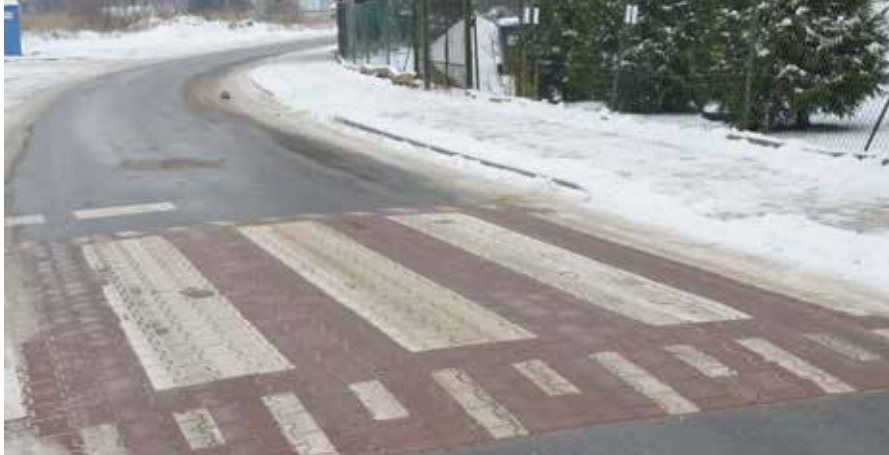
W ramach inwestycji drogowej w Wiśniówce powstały wyniesione przejścia dla pieszych.

Dobiegły końca prace związane z przebudową drogi wewnętrznej w Wiśniówce wiodącej od ulicy starego osiedla do ośrodka zdrowia i nowego „Leśnego Osiedla”. Inwestycja została odebrana i oddana do użytku.