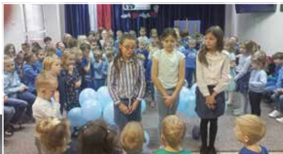
Występy artystyczne przybliżyły postać patrona szkoły.