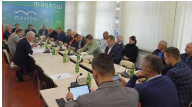
W programie sesji znalazły się trzy uchwały.