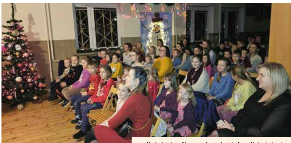
Dzieci i dorośli w czasie spektaklu bawili się świetnie.