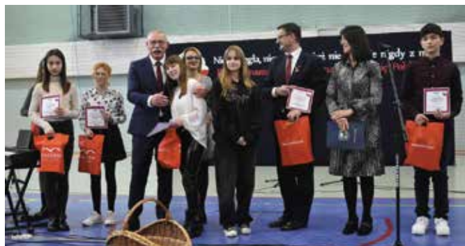
Laureatów konkursu ogłoszono 11 listopada podczas Gminnych Obchodów Narodowego Święta Niepodległości.