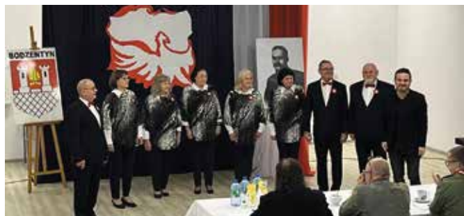
Nasi artyści zaprezentowali swoje interpretacje patriotycznych piosenek.

Grupa Artystyczna Golica okazała się najlepsza w swojej kategorii podczas patriotycznego przeglądu w Bodzentynie.