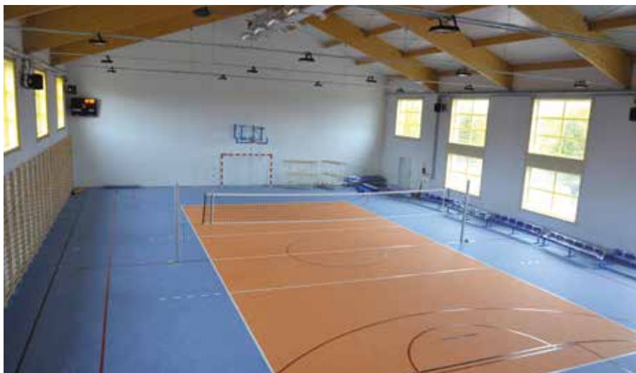
Trwa doposażanie nowego skrzydła budynku przy Szkole Podstawowej w Woli Kopcowej. W obiekcie powstała sala gimnastyczna o wymiarach 30x20 metrów.

Gmina Masłów to również stabilna oświata. W każdej ze szkół uczniowie