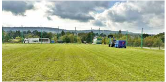
To już kolejne pielęgnacyjne prace na boisku treningowym i płycie głównej.