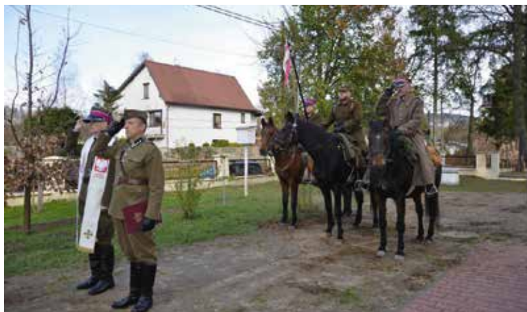
W spotkaniu udział wzięli m.in. członkowie Stowarzyszenia Rekonstrukcji Historycznych „Żołnierze z Gór Świętokrzyskich”.