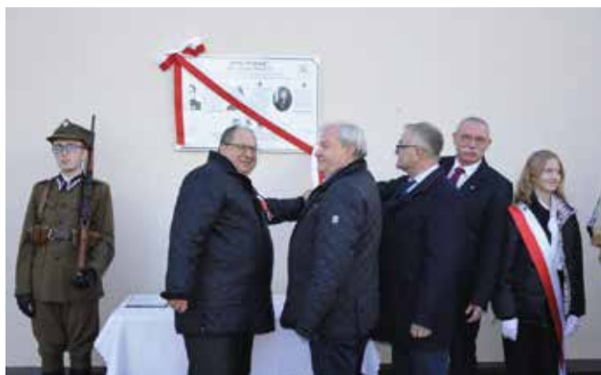
Podczas uroczystości tuż obok dębów na ścianie szkoły odsłonięto tablicę pamiątkową, zawierającą nazwiska policjantów związanych z regionem świętokrzyskim, zamordowanych w Twerze wiosną 1940 roku i pogrzebanych w Miednoje.

Przed placówką od strony zachodniej zasadzono brakujący dąb pamięci katyńskiej. - Idea zachowania pamięci o ofiarach NKWD z 1940 roku poprzez sadzenie imiennych Dębów Pamięci pojawiła się w Mącholicach Kapitulnych już wiele lat temu. Jesienią 2012 roku przed szkołą zasadzono trzy drzewa, każde stało się żywym pomnikiem symbolizującym bohaterów. Niestety jeden