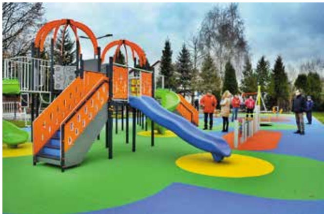
To najbardziej kolorowy plac zabaw w gminie Masłów.

Dobiegła końca budowa nowoczesnego, interaktywnego placu zabaw, który powstał przy Szkole Podstawowej im. Janusza Korczaka w Woli Kopcowej. Kolorowa i pełna różnorodnych atrakcji przestrzeń stanowi nie lada gratkę dla najmłodszych mieszkańców sołectwa. Obiekt, którego koszty pokryły środki z budżetu gminy został zainicjowany przez mieszkańców podczas zebrania w sprawie przeznaczenia funduszu sołectkiego na 2023 rok.