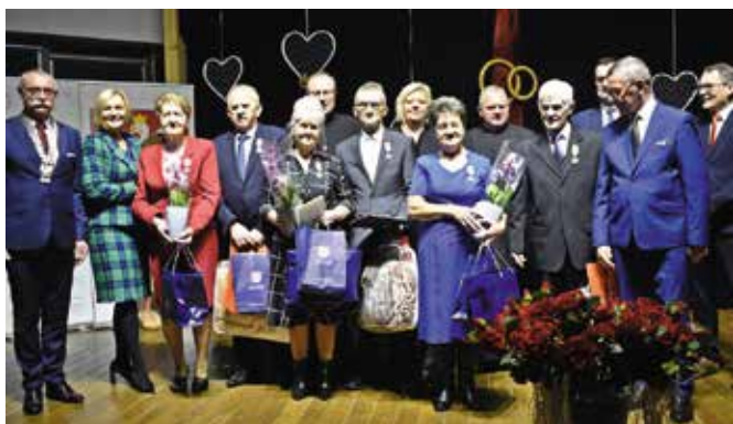
Oficjalna część odbyła się na scenie „Szklanego Domu”.