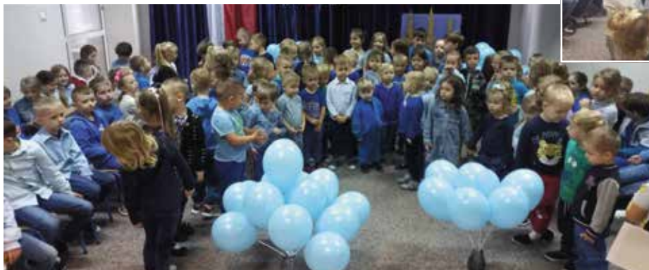
Podczas wydarzenia dominował kolor niebieski, który jest symbolem solidarności ze wszystkimi dziećmi na świecie.