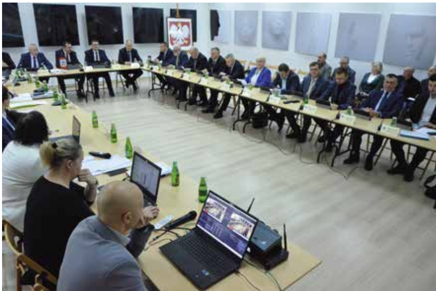
Listopadowa sesja Rady Gminy Masłów odbyła się w „Szklanym Domu”.

Jednym z najważniejszych momentów listopadowej sesji Rady Gminy Masłów było głosowanie radnych w sprawie określenia wysokości stawek podatku od nieruchomości na 2024 rok. Co bardzo ważne wychodząc naprzeciw mieszkańcom gminy Masłów wójt zaproponował, by wysokość stawek podatku od nieruchomości