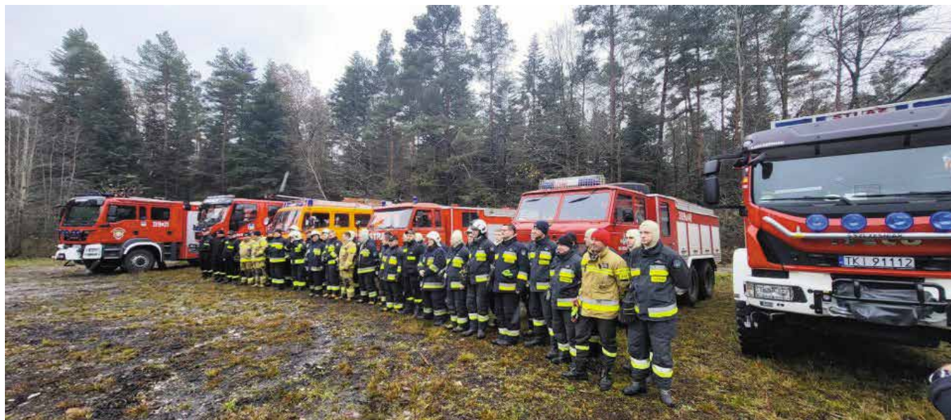
Do zajęć praktycznych w obrębie lasów Leśnictwa Brzezinki przystąpili nasi druzhowie.