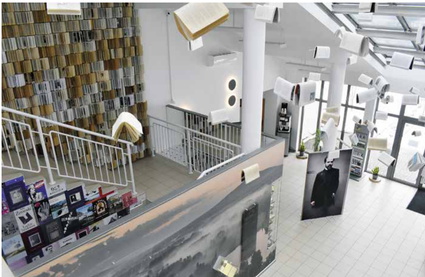
Centrum Edukacji i Kultury „Szklany Dom” zyskało nowoczesną, interaktywną wystawę.

o wsparciu dla osób z niepełnosprawnościami, które w tym roku uzyskały wsparcie asystenta osobistego. Na ten cel w ramach Programu Asystent Osobisty Osoby Niepełnosprawnej do gminy trafiła rekordowa ilość pieniędzy, bo aż ponad 2 mln zł. Asystent poświęca 60 godzin miesięcznie osobom ze znacznym stopniem niepełnosprawności, a 70 – osobom niepełnosprawnym ze znacznym stopniem niepełnosprawności z niepełnosprawnością sprzężoną. W tym roku z projektu skorzystały 124 osoby, w tym 17 dzieci do 16 roku życia, którym pomagało 104 asystentów.