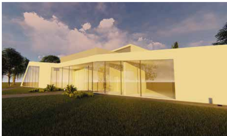
Tak będzie wyglądało Centrum Historii Lotnictwa w centrum Masłowa Pierwszego.

Wiele działa się również w sferze pomocy społecznej. Gminny Ośrodek Pomocy Społecznej w Masłowie realizuje wiele projektów, które realnie wpływają na polepszenie jakości życia mieszkańców gminy Masłów. Warto wspomnieć choćby