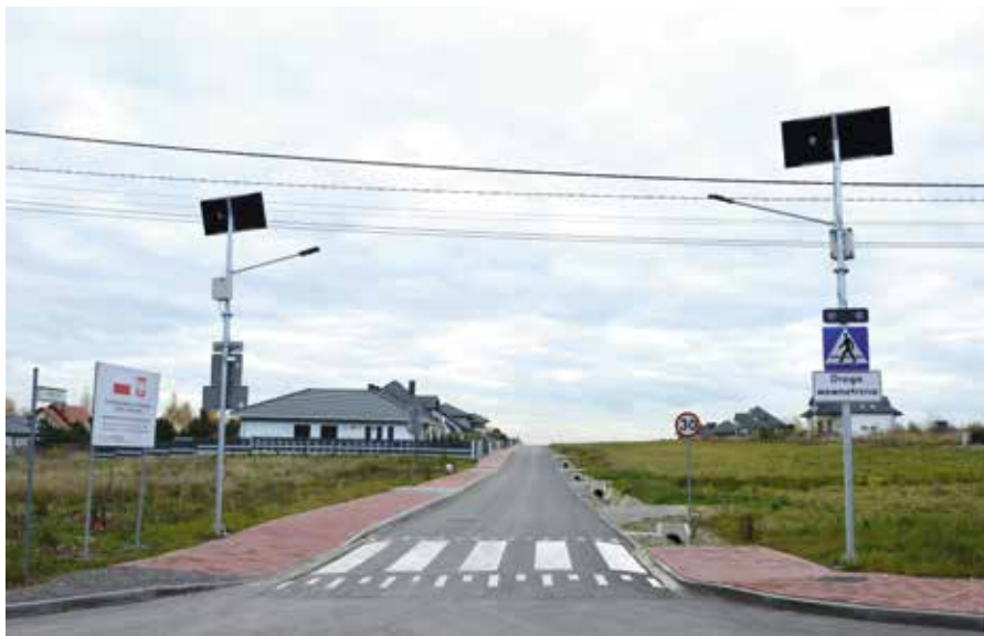
Ulica Malinowa w Domaszowicach zyskała chodnik, nawierzchnię asfaltową oraz oznakowanie poziome i pionowe.

Niezwykle istotne były w tym roku inwestycje wodno-kanalizacyjne. Ponad 9-milionowe rządowe dofinansowanie pozwoliło na uzupełnienie infrastruktury wodno-kanalizacyjnej w gminie Masłów. Dzięki niemu w 2023 roku powstało w sumie dziesięć odcinków sieci wodociagowych i kanalizacyjnych. Prace wykonywane były na odcinkach w Masłowie Pierwszym na ulicy Podklonówka, w Domaszowicach na ulicy Klonowej, Rodzinnych Ogrodach Działkowych – Zielona Dolina, w Masłowie Drugim na ulicy Panoramicznej, w Masłowie Pierwszym na ulicy Panoramicznej, w Ciekotach, Wiśniówce na tzw. Starodrożu. Ich