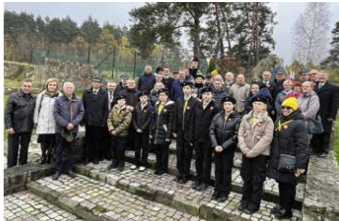
Wspólne zdjęcie przed pomnikiem w Wiśniówce to już tradycja.