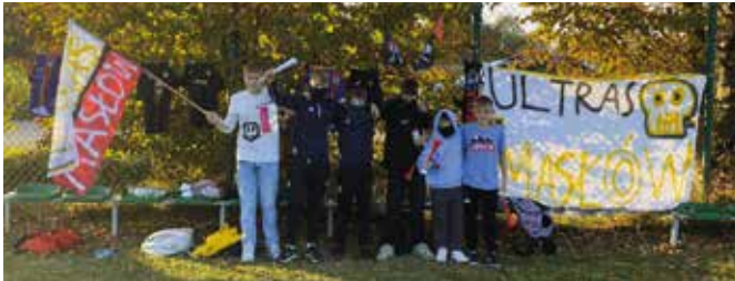
Drużyna MSS Klonówki Masłów.

W 9 kolejce klasy A z wyjazdowego meczu w Mniowie nasi zawodnicy wrócili bez punktów. Niestety mimo walki, zaangażowania i co najważniejsze prowadzenia 2-0 nie udało się dowieść korzystnego rezultatu do końca spotkania. Dobra pierwsza połowa zaowocowała streleniem dwóch goli, ale niestety druga część gry należała już do gospodarzy. A decydującego gola nasi zawodnicy stracili w 90 minucie z rzutu karnego.