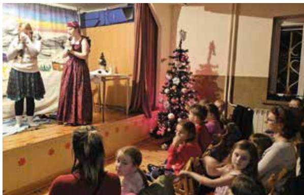
Teatr Maska wprowadził w świąteczny nastrój.