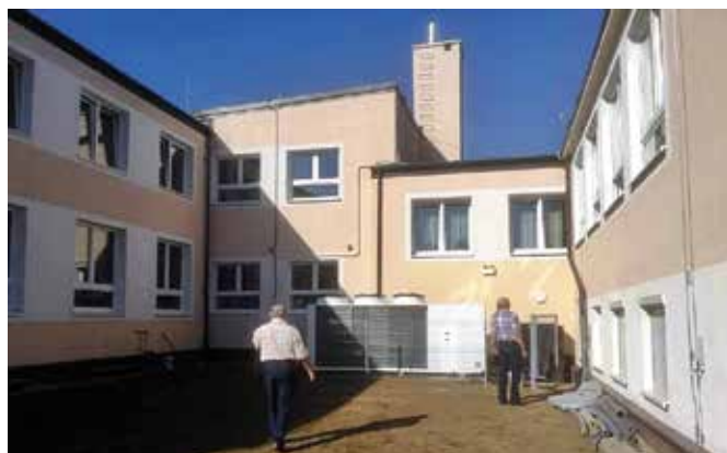
W ramach przeprowadzonych robót budynek został ocieplony, a jego ściany fundamentowe wyizolowano i odwodniono poprzez zastosowanie odpowiedniego drenażu.

da. Zmodernizowano również systemy oświetlenia wewnętrznego i zewnętrznego poprzez zastosowanie energooszczędnych opraw LED. W szkole wymieniono okna, parapety zewnętrzne i wewnętrzne oraz drzwi zewnętrzne. Większy zakres prac termomodernizacyjnych przeprowadzono w starej części budynku, gdzie docieplone zostały strop nad parterem, stropodach wraz z wykonaniem nowego pokrycia z papy, podłoga na gruncie, która dodatkowo została zabezpieczona przed wilgocią. Na dachu budynku szkoły zamontowano instalację fotowoltaiczną.