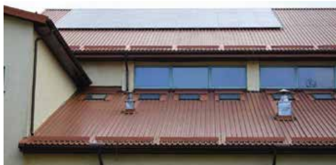
88 paneli fotowoltaicznych pojawiło się na dachu hali sportowej w Masłowie.

W 2023 roku środki z Regionalnego Programu Operacyjnego Województwa Świętokrzyskiego na lata 2014-2020 w ramach działania „Poprawa efektywności energetycznej w budynkach użyteczności publicznej – REACT-EU” w wysokości 1 mln 870 tys. zł pozwoliły na przeprowadzenie termomodernizacji Szkoły Podstawowej w Mąchocicach Kapitulnych. Budynek podobnie jak urząd zyskał panele fotowoltaiczne i pompę ciepła. Do końca przyszłego roku odnawialne źródła energii pojawią się również w strażnicach w Mąchocicach Kapitulnych i Ciekotach. 90-procent kosztów za-