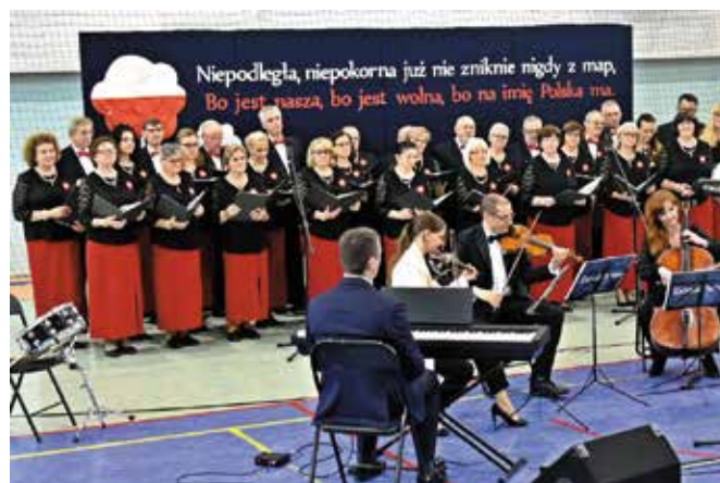
Chór Masłowianie i kwartet Estradi Various.