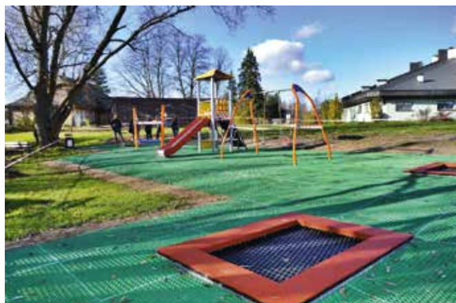
Rozbudowa placu zabaw to odpowiedź na potrzeby najmłodszych mieszkańców.