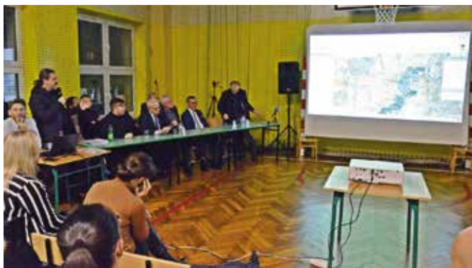
Omówiono wszystkie warianty przebiegu obwodnicy.