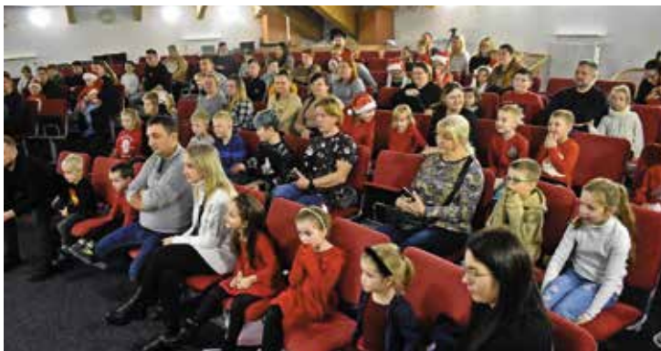
Na seans filmowy dzieciaki przyszły z rodzicami i dziadkami.