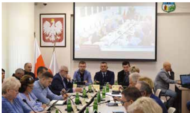
Sesja Rady Gminy Masłów odbyła się w sali samorządowej Urzędu Gminy.

W kolejnym punkcie Komisja Ochrony Środowiska, Gospodarki Nieruchomościami i Rolnictwa przedstawiła informację na temat komunalizacji działek stanowiących drogi w sołectwie Brzezinki.