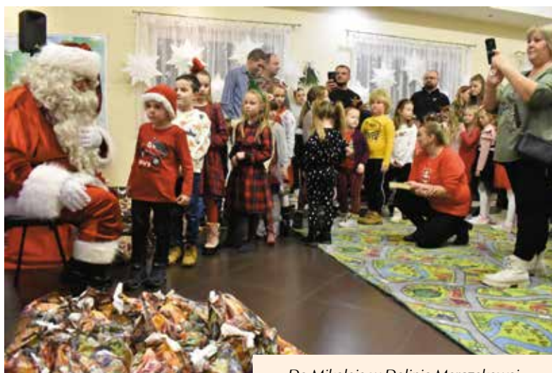
Do Mikołaja w Dolinie Marczałkowej ustawiła się długa kolejka.

Jakich zabawek produkuje najczęściej fabryka Mikołaja? W czym pomagają elfy? Na te pytania odpowiadał Mikołaj podczas spotkania, które odbyło się w Centrum Edukacji i Kultury „Szklany Dom” w Ciekotach. Na finał na wszystkich czekał rodzinny seans filmowy „Renifer Niko ratuje Świąta”. Nie zabrakło oczywiście prezentów, które wręczał Mikołaj oraz słodkości dla każdego dziecka.