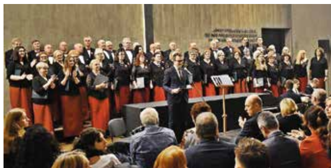
Zasępowały połączone chóry Masłowianie i Con Passione.