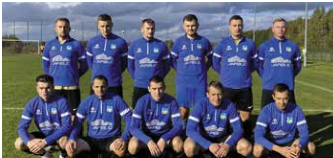
Nasi zawodnicy podczas meczów w Brzezinkach mogą liczyć na ogromne wsparcie kibiców.

W kolejnym meczu w 10 kolejce klasy A nasza drużyna zremisowała na własnym stadionie z Polonia Białogon Kielce 2:2 (1:2). Nie było to szczęśliwe spotkanie, bo już po 10 minutach zawodnicy przegrywali już 0:2. Przyczyniła się do tego niska frekwencja na treningach spowodowana licznymi urazami i głównie chorobami. MSS Klonówka Masłów mogła liczyć na ogromny doping kibiców, a szczególnie młodych zawodników akademii.