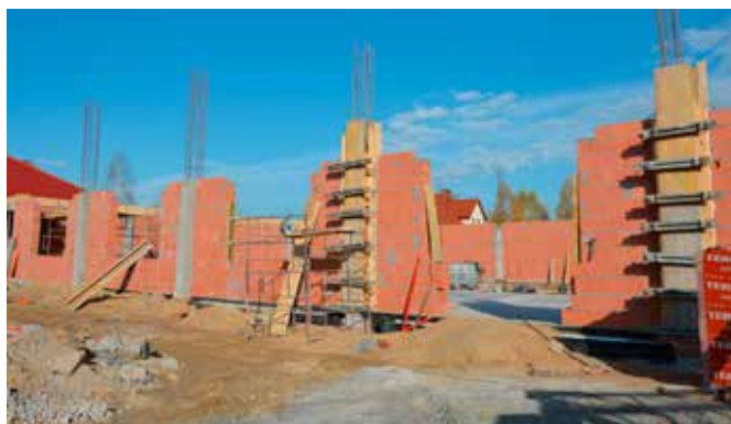
Zgodnie z projektem w nowym budynku powstanie sala sportowa o płycie boiska 20 x 30 m.