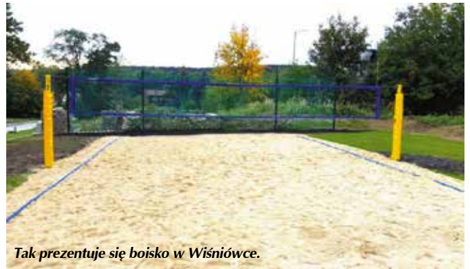
Tak prezentuje się boisko w Wiśniówce.

- W planach, mających na celu zwiększenie atrakcyjności nowo powstałego boiska jest stworzenie strefy relaksu wyposażonej w ławeczki, które pojawią się w przyszłym roku. Wtedy też boisko