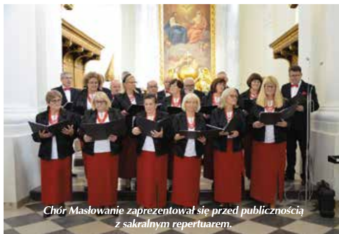
Chór Masłowianie zaprezentował się przed publicznością z sakralnym repertuarem.