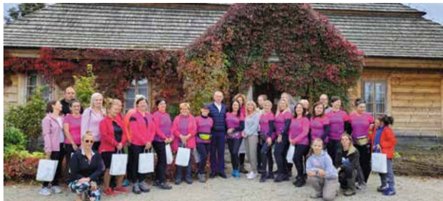
Finał odbył się przed dworkiem Stefana Żeromskiego.

Poprzednie edycje również cieszyły się dużym zainteresowaniem. Pierwsza odbyła się w marcu 2019 roku. Przeszło w niej wtedy 77 osób na dwóch trasach, liczących 5 i 11 km. Druga edycja, w październiku 2020 r., również liczyła dwie trasy po tyle samo kilometrów. Trzecia edycja miała miejsce w październiku 2021 r., a jej trasa liczyła 10 km.