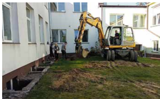
Obecnie roboty obejmują ocieplenie i wyizolowanie ścian fundamentowych, przy których powstanie odpowiedni drenaż.

- Szkoła w Mącholicach Kapitulnych jest już ostatnią szkołą, która wymagała termomodernizacji. Prosimy uczniów, nauczycieli i rodziców o cierpliwość i wyrozumiałość. Dzięki rozpoczętej in-