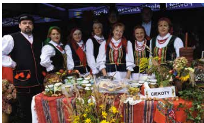
Zespół Pieśni i Tańca Ciekoty zagrał koncert, a w konkursie kulinarnym zdobył wyróżnienie.