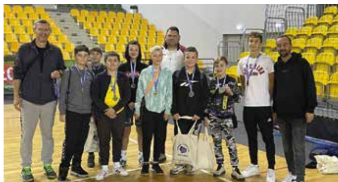
Masłowska reprezentacja w czasie II Olimpiady Świętokrzyskiej.