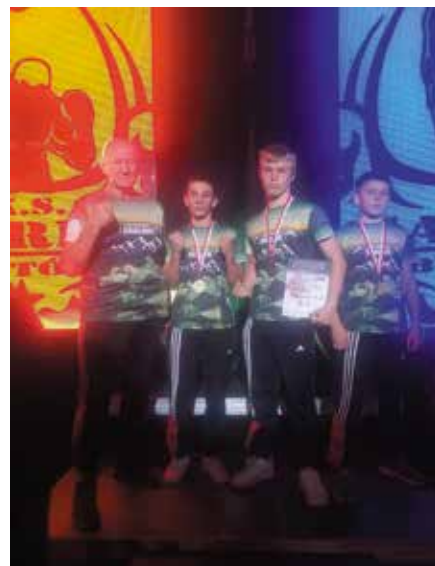
Ekipa na mistrzostwa w Bytowie.

W Skarżysku-Kamiennej odbył się mecz ligowych rozgrywek pomiędzy woj.