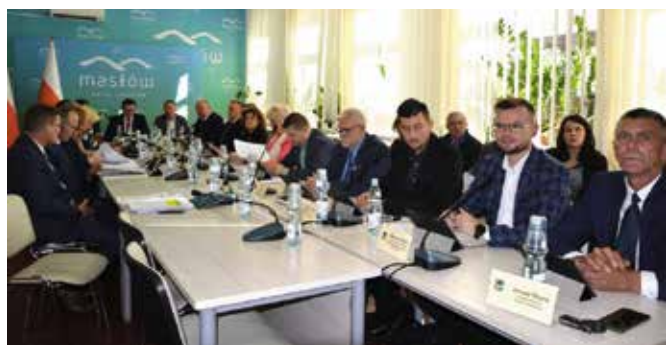
Radni przyjęli szereg uchwał.

W kolejnym punkcie głosowano w sprawie uchylenia Uchwały Nr XX/142/2012 Rady Gminy Masłów z dnia 24 kwietnia 2012 roku w sprawie wprowadzenia stałych terminów obrad Rady Gminy Masłów. Ma to związek z tym, że kompetencje wynikające z przepisów są realizowane na bieżąco przez wójta gminy i podle-