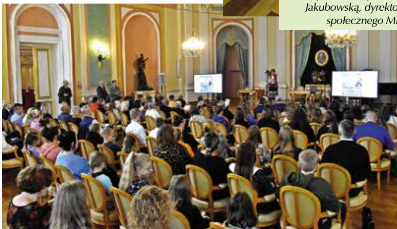
Sesja naukowa odbyła się w sali koncertowej.