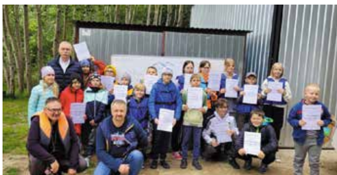
To było radosne podsumowanie sezonu.

Młodzi żeglarze ze Szkółki Żagle Cedzyna wraz z rodzicami i organizatorami zajęć zakończyli sezon żeglarski i podsumowali działalność szkółki. Zajęcia odbywały się dzięki programowi dofinansowanemu przez gminę Masłów, w ramach działalności pożytku publicznego.