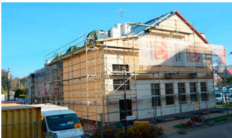
Termomodernizacje urzędu oraz szkoły są realizowane dzięki dofinansowaniu w wysokości niemal 3 mln zł.