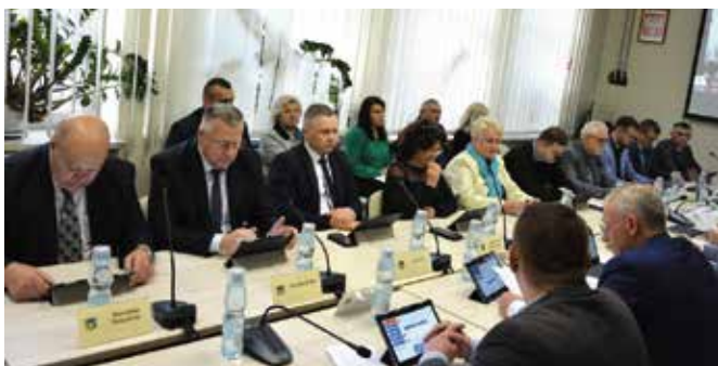
Jak na każdej sesji wprowadzono również zmiany budżetowe.