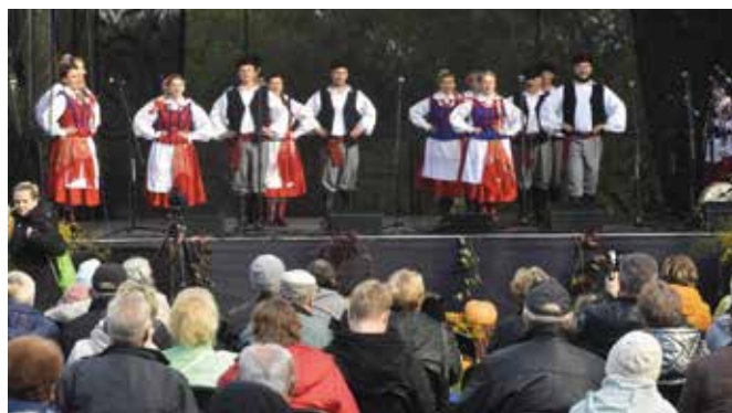
Na scenie Zespół Pieśni i Tańca Żeromszczyzna.