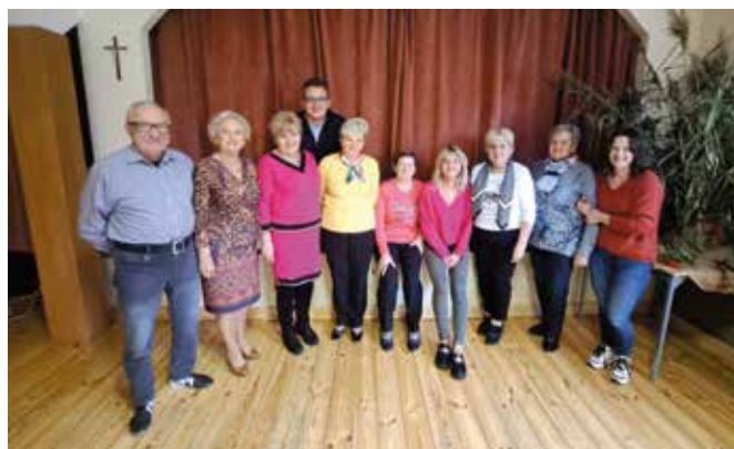
Rada Senioralna rozmawia o planach na kolejne miesiące działalności.