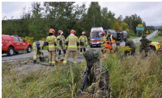
Widowiskowe ćwiczenie odbyły się na drodze w Dąbrowie.

Zakres przedmiotowy ćwiczenia obejmował planowanie, organizację i realizację zadań obronnych i zarządzania kryzysowego przez organy administracji rządowej i samorządowej, wydzielone siły i środki: Sił Zbrojnych RP, Policji, Państwowej Straży Pożar-