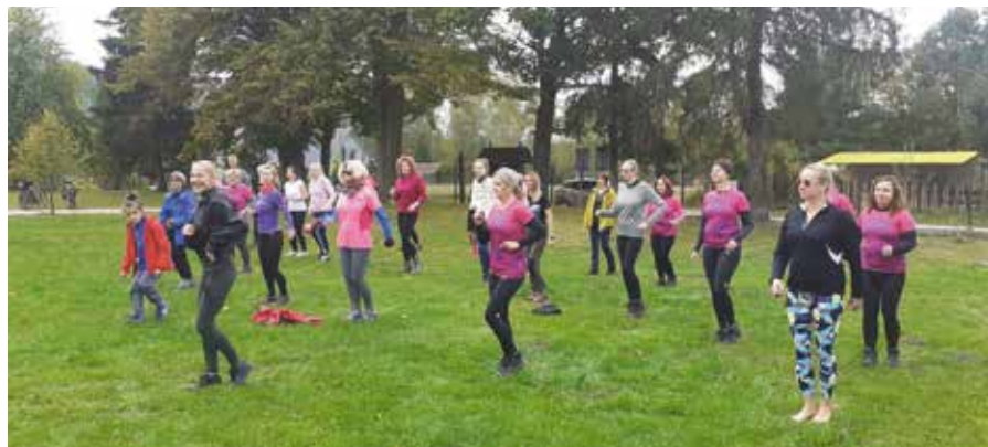
Na zakończenie odbyła się lekcja tańców latino.