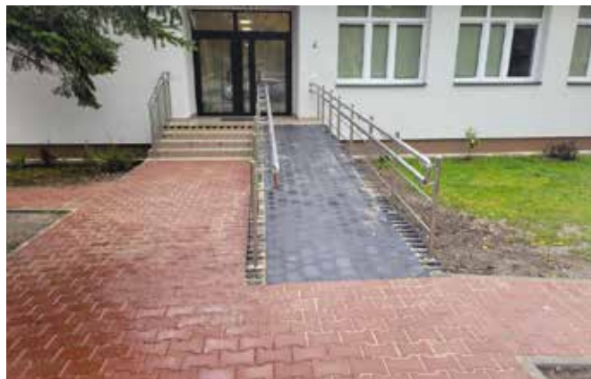
To niewielkie, ale potrzebne zadanie, którego realizacja pozwoliła wyeliminować istotną barierę architektoniczną w budynku szkoły.