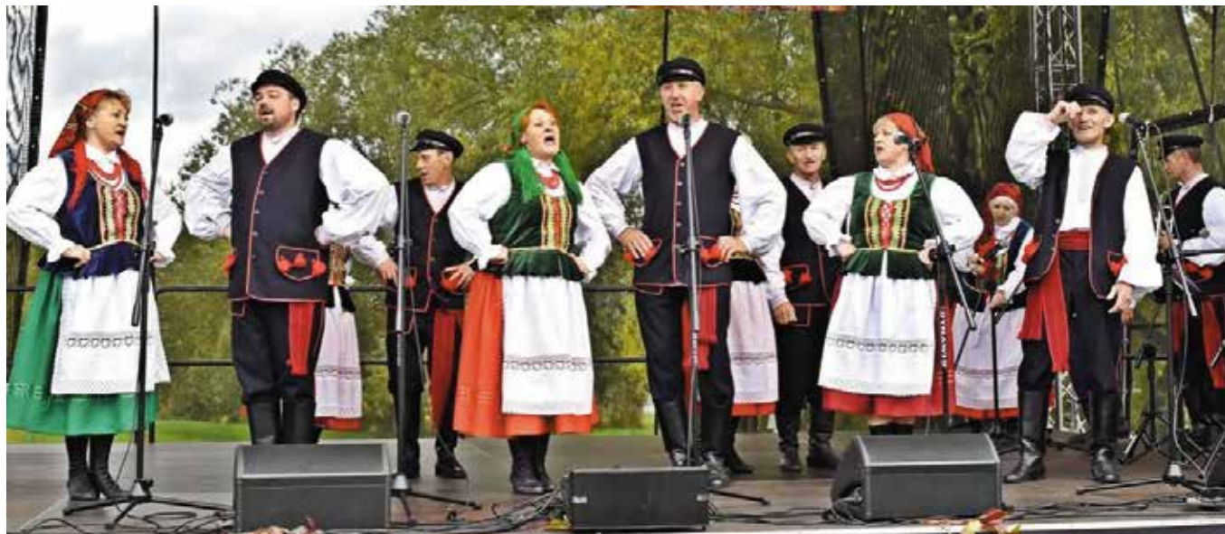
Zespół Pieśni i Tańca Ciekoty w czasie finałowego koncertu zaprezentował się w nowych strojach.

Zespół Pieśni i Tańca Ciekoty to wizytówka nie tylko gminy Małków, ale również regionu świętokrzyskiego. Dzięki dotacji z programu EtnoPolska 2022 ze środków Ministerstwa Kultury i Dziedzictwa Narodowego członkowie grupy występują już w nowych tradycyjnych świętokrzyskich strojach ludowych.