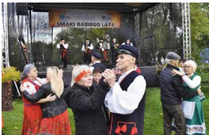
Kapela Adaški porwała do tańca.

W kategorii warzywa pierwsze miejsce zajęły KGW Sasanki za czosnek z grzybami i majerankiem w marynacie. Drugie miejsce przypadło KGW Piotrów, a trzecie Aktywna Brynica. Wyróżnienia