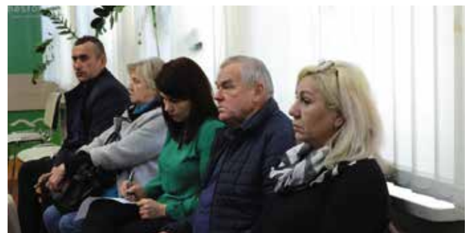
Obradom przysłuchiwali się sołtysi.