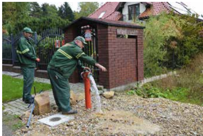
Zakończona inwestycja umożliwi zaopatrzenie w wodę oraz ochronę przeciwpożarową istniejącą i przewidywaną zabudowę mieszkaniową jednorodzinną.

Przed nami jeszcze inwestycje wodno-kanalizacyjne, które będą realizowane z rządowym, niemal 10 milionowym, dofinansowaniem. Dzięki środkom zewnętrznym odcinki wodociągu po-