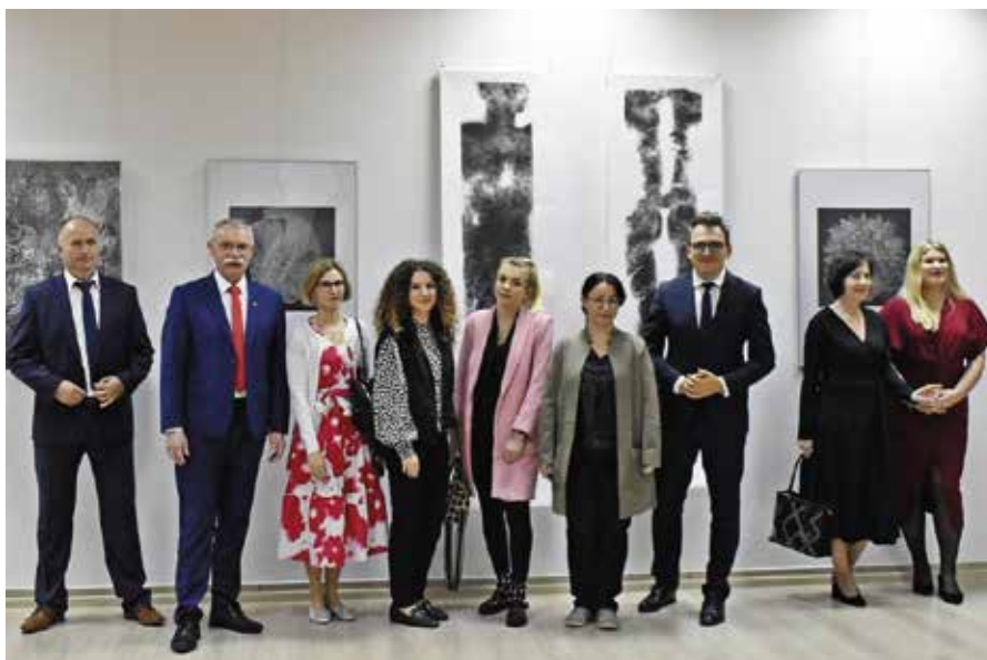
Wernisaż wystawy Kieleckiej Szkoły Linorytu.