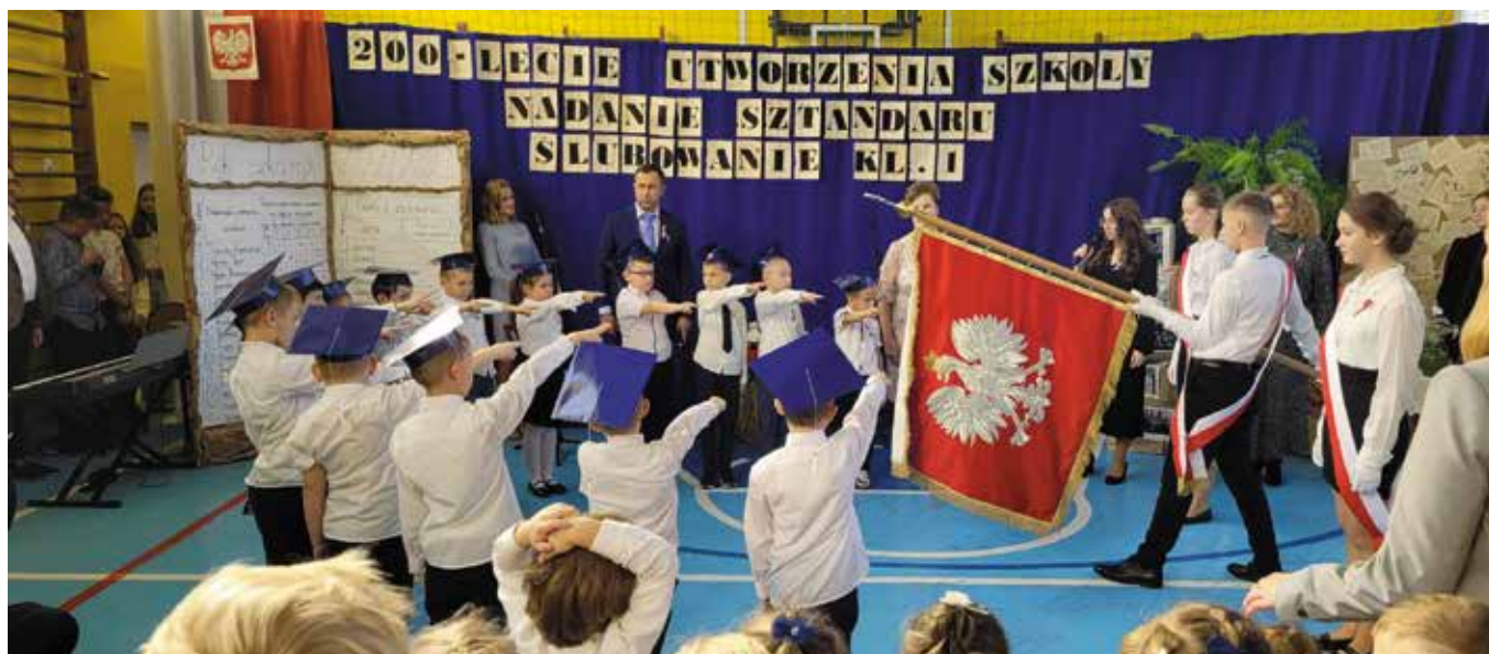
Dzieci z pierwszych klas zostały przyjęte w poczet uczniów i ślubowały na nowy sztandar.