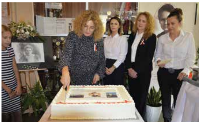
Na zakończenie podzielono jubileuszowy tort.