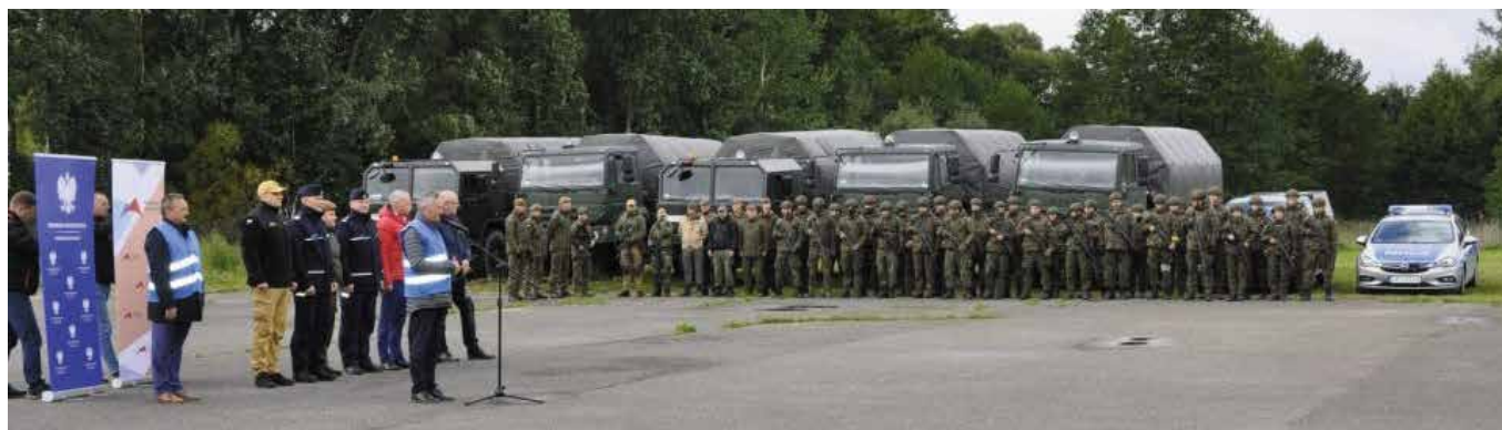
Akcję podsumowano na lotnisku.