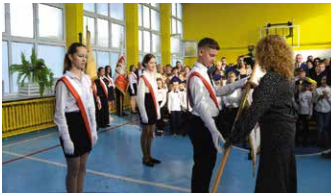
...po czym przekazała go uczniom.