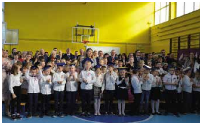
To było święto całej szkoły.