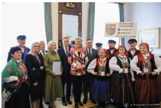
Z Prezydentem RP Andrzejem Dudą i Pierwszą Damą Agatą Kornahauser-Dudą.