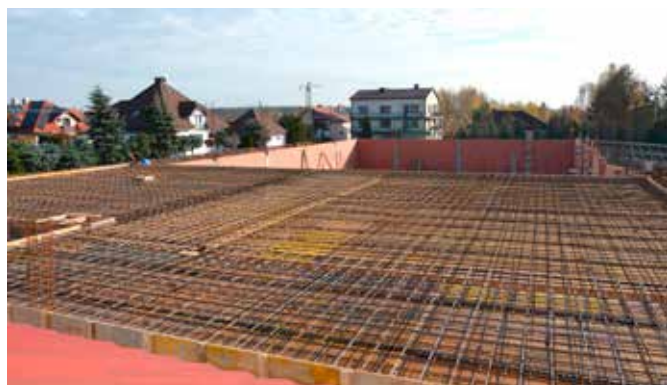
Koszt całkowity inwestycji to 7,5 mln zł, z czego 5,7 mln zł pokryje dofinansowanie z „Polskiego Ładu”.

pełniające: dwie szatnie z łazienkami wyposażonymi w kabiny prysznicowe, magazynki oraz pokój dla nauczycieli wychowania fizycznego. Dodatkowo na najniższej kondygnacji zlokalizowane będą dwie sale lekcyjne, ogólnodostępna łazienka przystosowana dla osób z niepełnosprawnościami oraz kotłownia. Na piętrze budynku zlokalizowane będą kolejne dwie sale lekcyjne oraz sala rekreacyjno-sportowa z wykładziną sportową przystosowaną do zajęć korekcyjnych i fitness itp. Całość uzupełnią dwie łazienki ogólnodostępne oraz widownia umożliwiająca obserwację zajęć