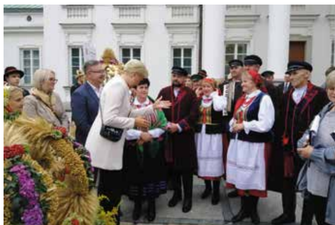
Pierwszego dnia Agata Kornahauser-Duda oceniała wieńce i rozmawiała z delegacjami.