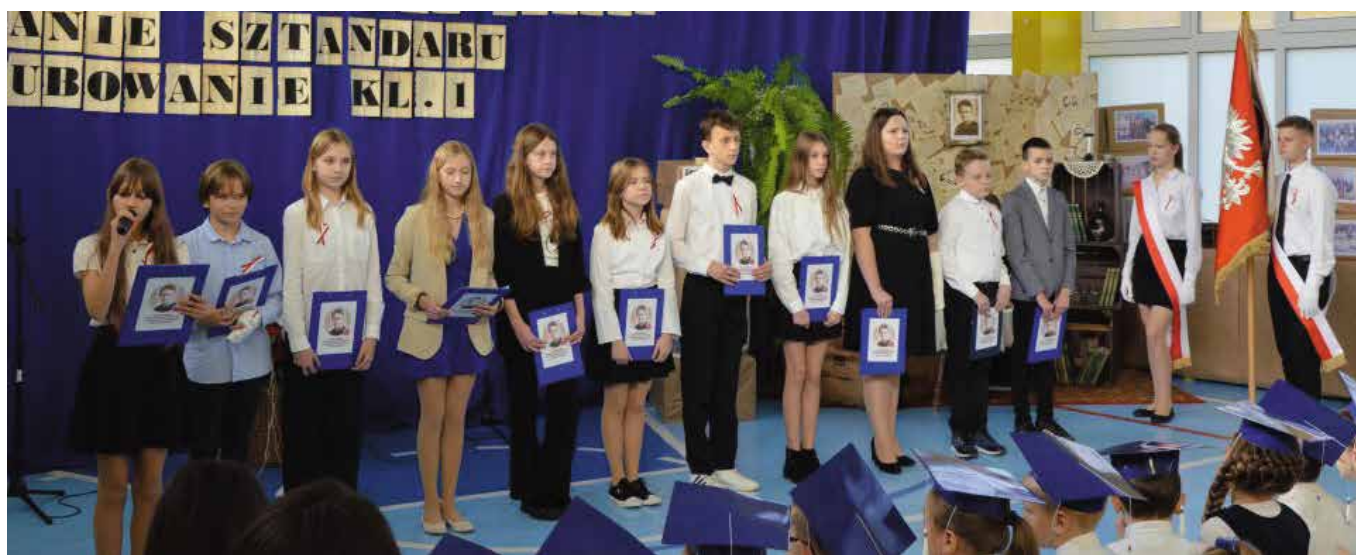
Uczniowie przygotowali specjalny program artystyczny.