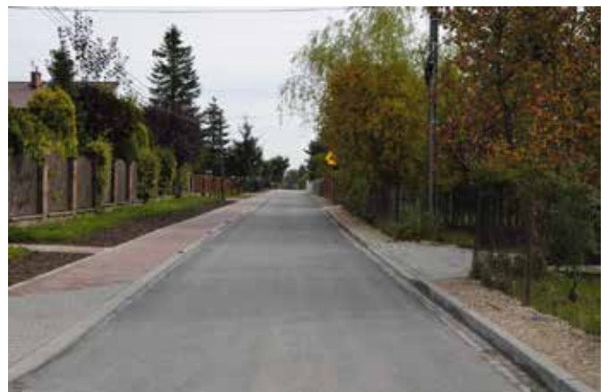
W ramach robót ulica Letniskowa zyskała nową nawierzchnię asfaltową o szerokości około 3,7 metra, na odcinku około kilometra.