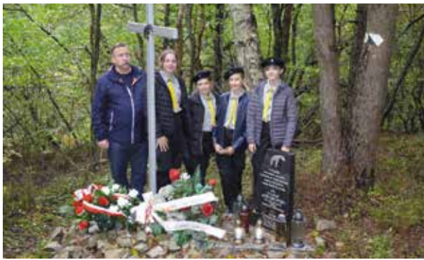
Delegacja masłowskiej szkoły przed pomnikiem w miejscu tragedii.