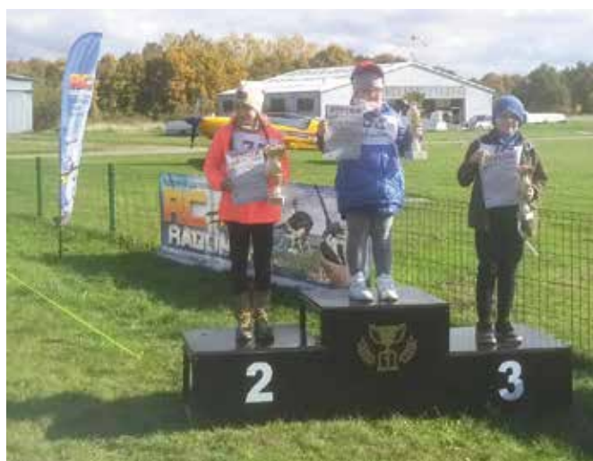
Gratulujemy młodym modelarzom!