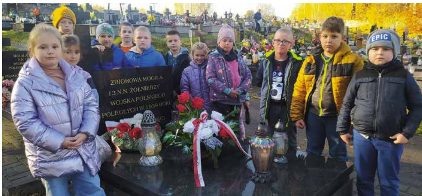
Tradycyjnie już uczniowie szkoły w Brzezinkach przy okazji świąt listopadowych odwiedzają groby żołnierzy.