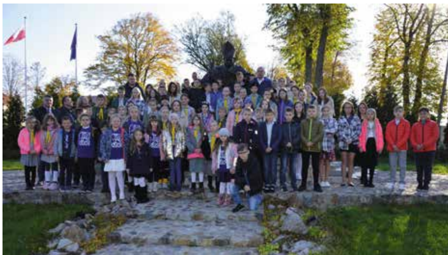
Pamiątkowe zdjęcie przed pomnikiem to już tradycja.