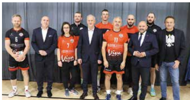
Nasza reprezentacja z organizatorami i gośćmi.