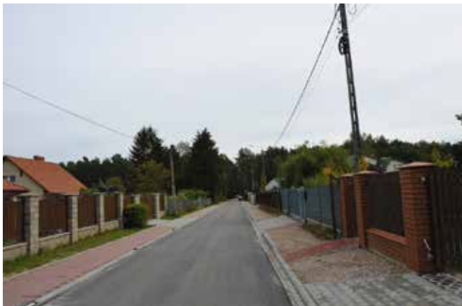
Przebudowa drogi w Woli Kopcowej była możliwa dzięki 70% dofinansowaniu z Rządowego Funduszu Rozwoju Dróg.