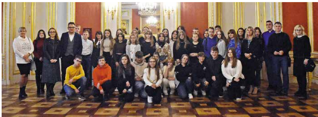
Delegacja z gminy Masłów na Zamku Królewskim w Warszawie.