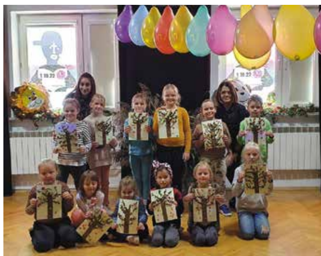
Dobra, edukacyjna zabawa podczas Nocy Bibliotek.