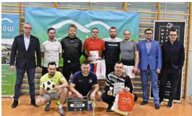
Zwycięscy turnieju Sam Relaks Team.

Siedem drużyn składających się z zawodników z gminy Masłów rywalizowało w Turnieju Piłki Nożnej Halowej o Puchar Wójta Gminy Masłów. Były sportowe emocje, zaskakujące zwroty akcji i rzuty karne. Najlepsza okazała się drużyna Sam Relaks Team.