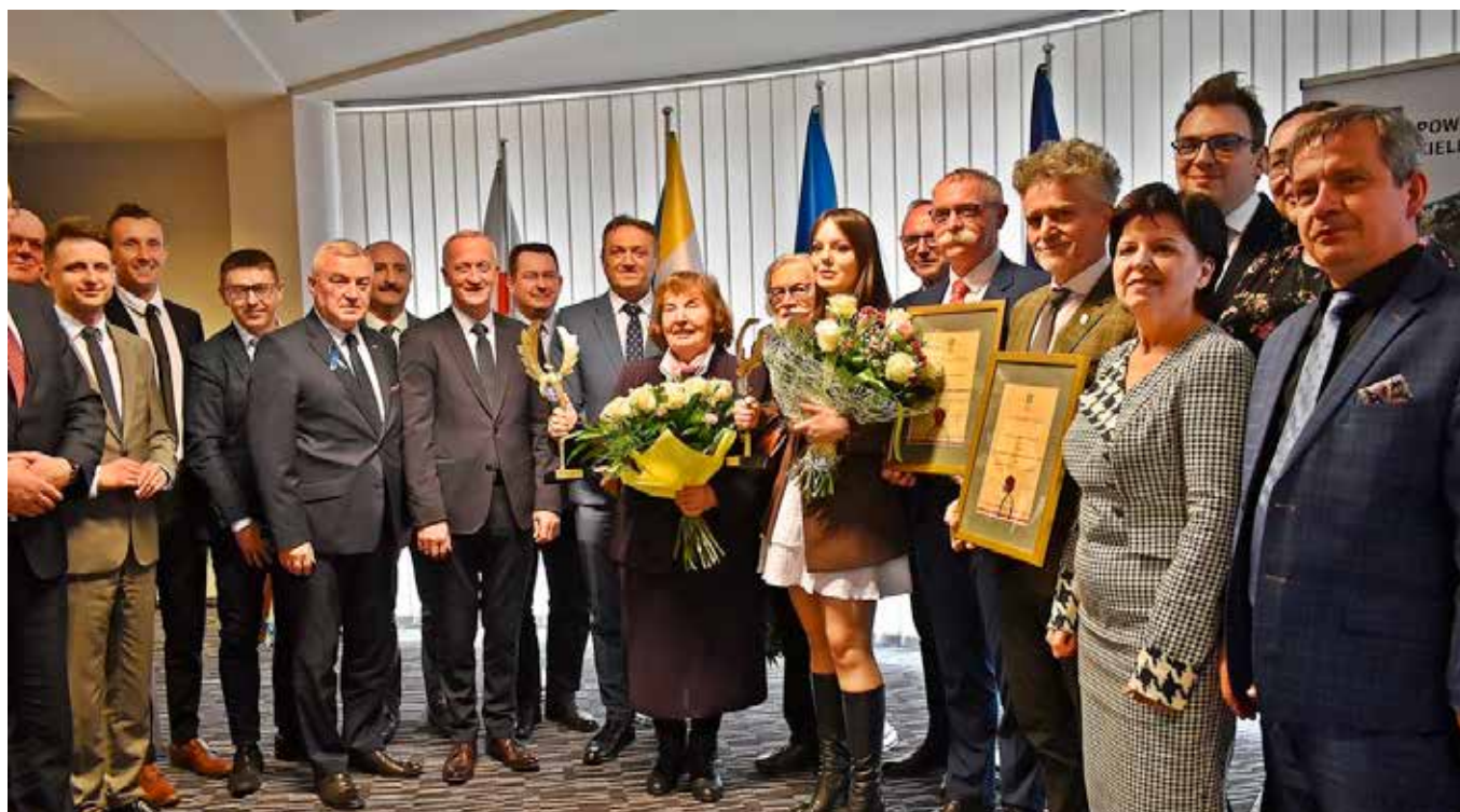
Zdjęcie, które przejdzie do historii. To była pierwsza sesja, podczas której przyznano nowe, ważne powiatowe wyróżnienia.