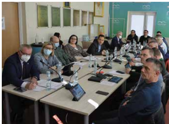
Debata odbyła się w systemie hybrydowym.

Wszyscy zostali zapoznani ze szczegółami misji rozwoju gminy, którą jest zapewnienie zrównoważonego wzrostu poziomu jakości życia mieszkańców oraz poprawa uwarunkowań społeczno-gospodarczo-przestrzennych i środowiskowych na terenie gminy Masłów. Omawiano również poszczególne zadania inwestycyjne wynikające z celów postawionych przed gminą. Są