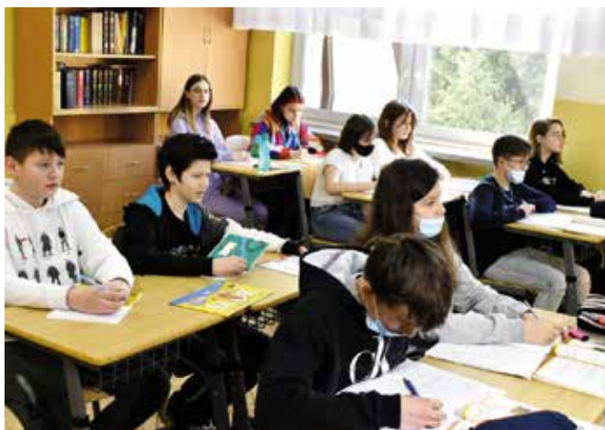
Od kilku tygodni do szkół dołączyli uczniowie z Ukrainy.