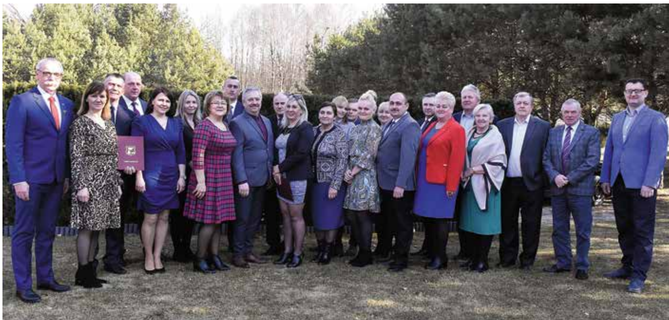
Sołtysi świętowali w gronie swoich małżonków.

Na co dzień są najbliższymi mieszkańców sołectw. Odpowiadają na pytania, rozwiązują problemy i są pierwszym łącznikiem z samorządem. Sołtysi z gminy Masłów uroczystie obchodzili swój dzień.