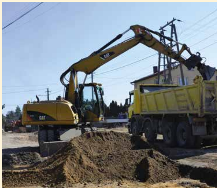
Trwają przebudowy dróg