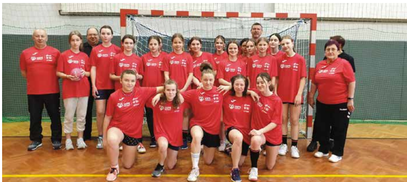
Uczestniczki zgrupowania z trenerami.