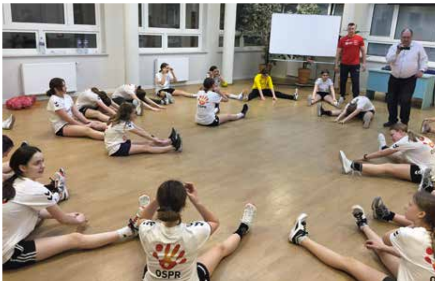
Podczas zgrupowania dziewczeta odbywały specjalistyczne treningi.