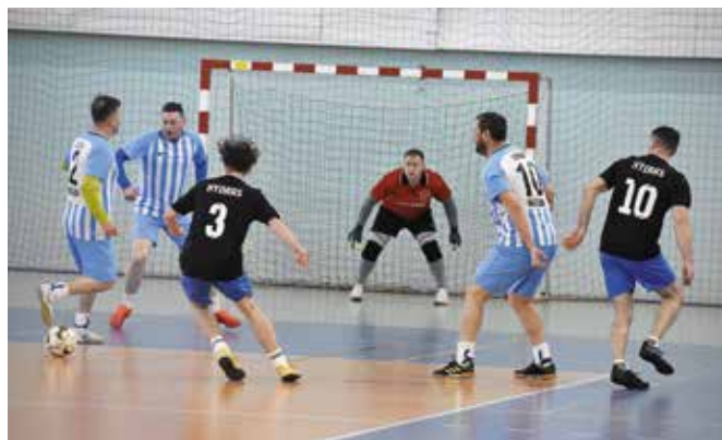
Gra była emocjonująca!