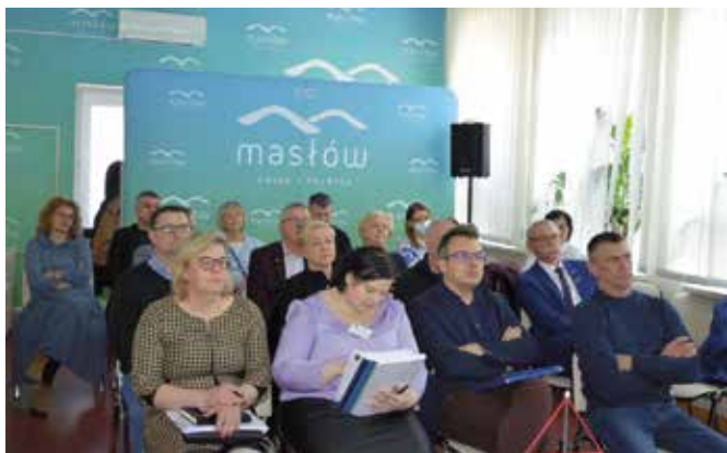
Wszyscy zostali zapoznani ze szczegółami misji rozwoju gminy.