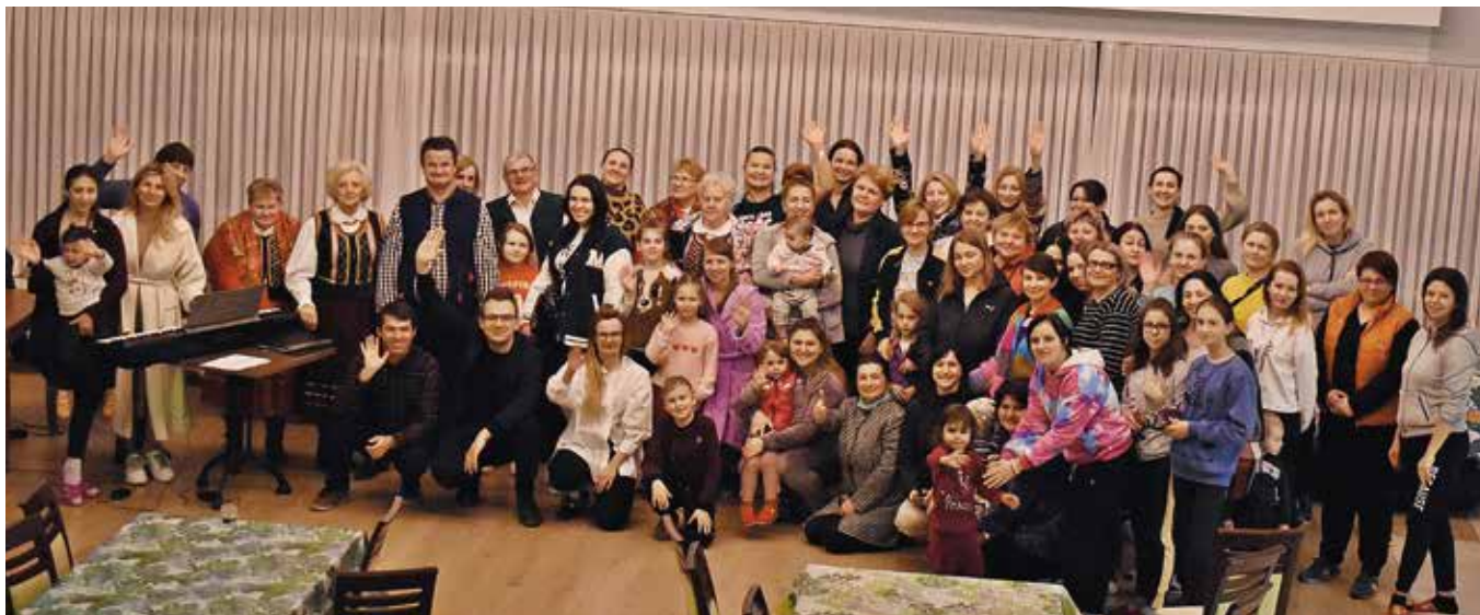
Lubrzanka koncertowała w Hotelu Ameliówka.

siedztwie. Wśród nich były: środki czystości osobistej, chemia dla domu, artykuły żywnościowe, woda, konserwy, ale też np. bielizna osobista. Punkty zbiórki znajdują się w szkołach i placówkach podległych urzędowi, a punkt wydawania darów dla obywateli Ukrainy, przebywających na terenie Gminy Masłów został uruchomiony w Gminnym Ośrodku Pomocy Społecznej w Masłowie.