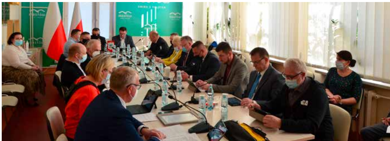
Podczas sesji radni wyznaczyli miejsce na terenie gminy do prowadzenia handlu w piątki i soboty przez rolników.

Zmiany budżetowe, przyjęcie programów związanych z profilaktyką i rozwiązywaniem problemów alkoholowych oraz opieki nad bezdomnymi zwierzętami, to jedne z najważniejszych uchwał podjętych podczas marcowej sesji Rady Gminy Masłów.