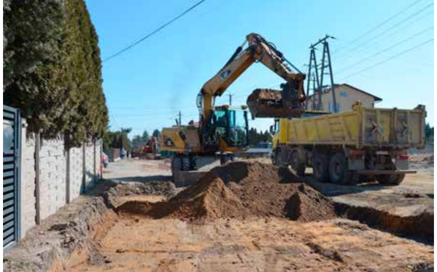
Prace na drogach potrwają do końca sierpnia.

Warto wspomnieć, że w trakcie procedury przetargowej jest przebudowa ulicy Szkolnej w Mącholicach Kapitulnych oraz projekty dróg tłuczniowych: ul. Zielonej na odcinku od ul. Działkowej w kierunku wschodnim do istniejącego utwardzenia z płyt betonowych, drogi wewnętrznej nr 818 na odcinku od ul. Zielonej do ul. Świerczyńskiej w Masłowie Pierwszym, ul. Jasnej w Domaszowicach na odcinku od ul. Kwiatów Polnych w kierunku wschodnim, drogi nr 200 w Mącholicach-Scholasterii i projekty nakładek bitumicznych na drogach gminnych wewnętrznych: ul. Foliowej w Masłowie Pierwszym odcinek boczny od drogi gminnej, ul. Szybówcowej w Dąbrowie od drogi 745 do ul. Barczańskiej i ul. Mąchockiej w Masłowie Drugim na odcinku około 300 metrów.