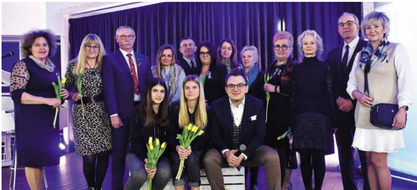
Goście i organizatorzy.

O sile ukraińskich kobiet i o wielkim wsparciu Polek dla Ukrainek mogli się przekonać ci wszyscy, którzy świętowali Dzień Kobiet w Centrum Edukacji i Kultury „Szklany Dom” w Ciekotach.