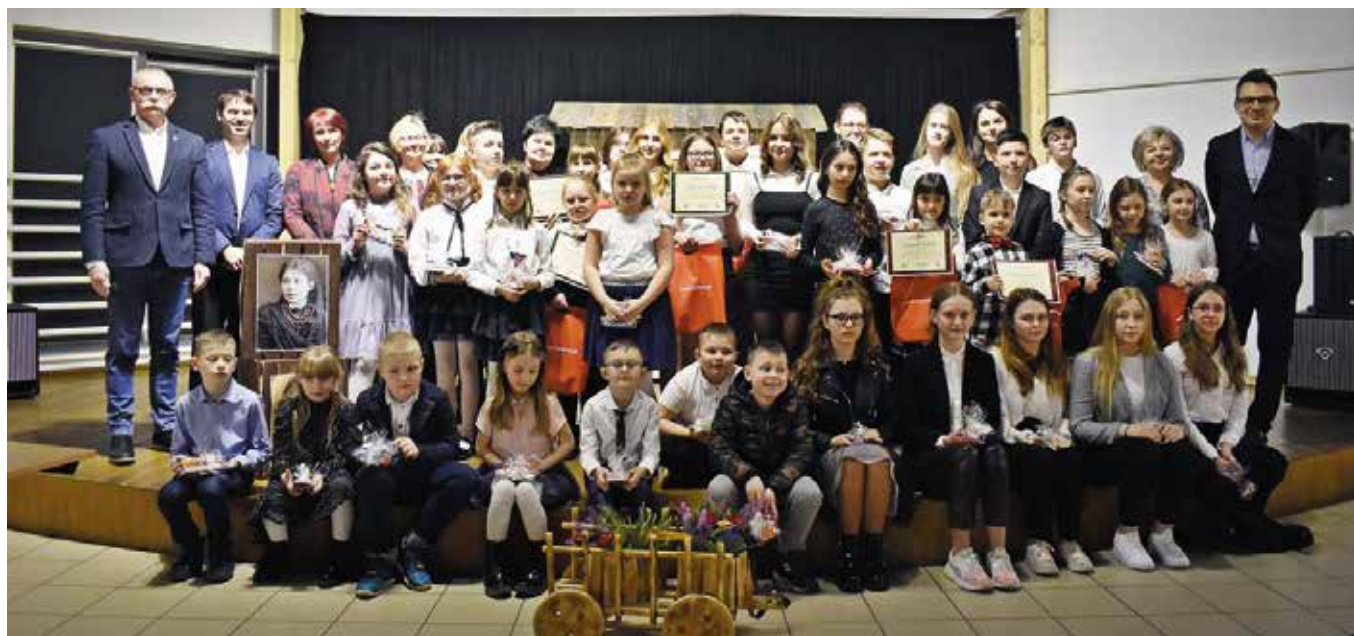
Laureaci i uczestnicy IX Gminnego Konkursu Recytatorskiego.