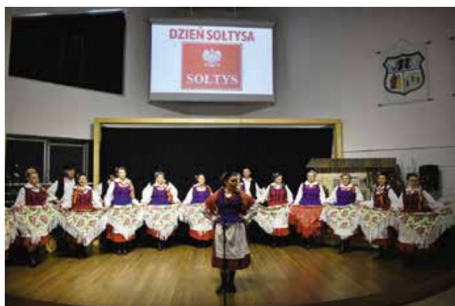
Zespół Pieśni i Tańca Żeromszczyzna