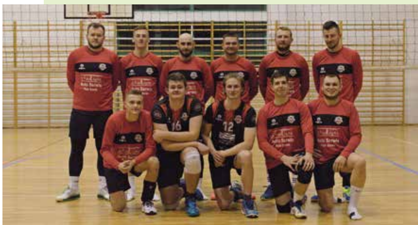
Drużyna MSS Małów – Siatkówka w nowych bluzach.

Konfrontacja półfinałowa była z całą pewnością ciekawym dla kibiców widowiskiem i stała na wysokim ligowym