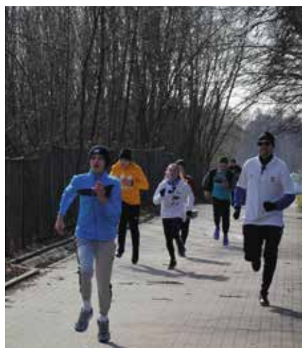
To było aktywne uczczenie pamięci.

Ponad czterdziestu uczniów klas IV-VIII Szkoły Podstawowej im. Jana Pawła II w Małowie przystąpiło do ogólnopolskiej akcji i wzięło udział w biegu „Tropem Wilczym” upamiętniającym Żołnierzy Wyklętych i Bohaterów Niezlomnych.