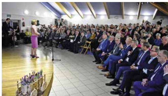
Do Ciekot przyjechali sołtysi z całego województwa.