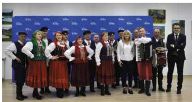
Zespół Pieśni i Tańca Ciekoty