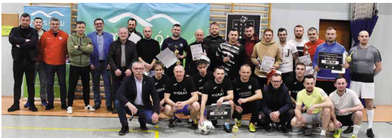
Pamiątkowe zdjęcie uczestników i organizatorów turnieju.

Po pandemicznej przerwie na parkiet masłowskiej hali sportowej powrócił Turniej Piłki Nożnej Halowej o Puchar Wójta Gminy Masłów. Do gry stanęły drużyny z gminy Masłów: Hydras, Renesans Sid-Trans, Lotnik Masłów, Absolutus, Sam Relaks Team, Domaszowice, Przedwiośnie. Po blisko pięciu godzinach rozgrywek wyłoniono zwycięzców. Najlepsza okazała się drużyna Sam Relaks Team. W nagrodę oprócz prestiżowego zwycięstwa i pamiątkowego dyplomu do zawodników powędrował voucher na 1 000 zł do wykorzystania na zakup sprzętu sportowego, voucher na trzy pizzy do Pizzerii Małomiasteczkowa oraz jak przystało na turniej...piłka. Drugie miejsce zajęła ekipa Hydras zdobywając voucher na 600 zł na sprzęt sportowy, voucher na trzy pizzy do Pizzerii Małomiasteczkowa oraz piłkę. Trzecie miejsce wywalczyła drużyna Przedwiośnie, co dało piłkarzom voucher na 300 zł, voucher na trzy pizzy do Pizzerii Małomiasteczkowa oraz piłkę.