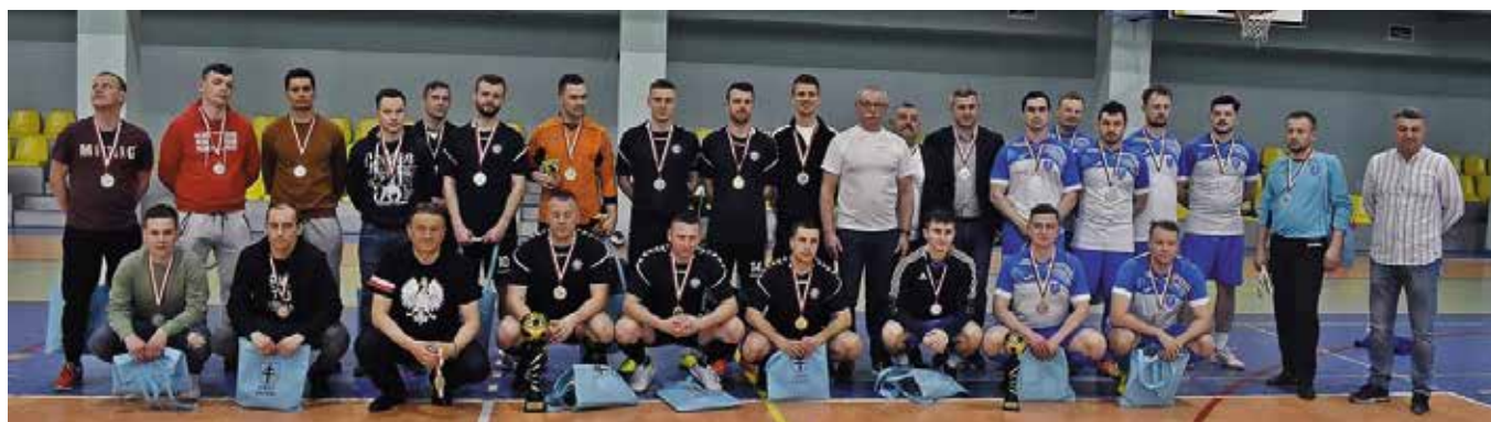
Zwycięskie drużyny pozowały do zdjęcia z organizatorami.

Emocjonujące mecze i rzuty karne. Tak do historii przeszły XX Halowe Mistrzostwa Radnych i Pracowników Samorządowych w Piłce Nożnej o Puchar Starosty Kieleckiego, które odbyły się w hali sportowej w Masłowie.