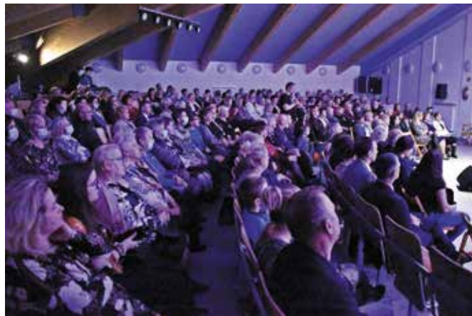
Sala „Szklanego Domu” była wypełniona do ostatniego miejsca.