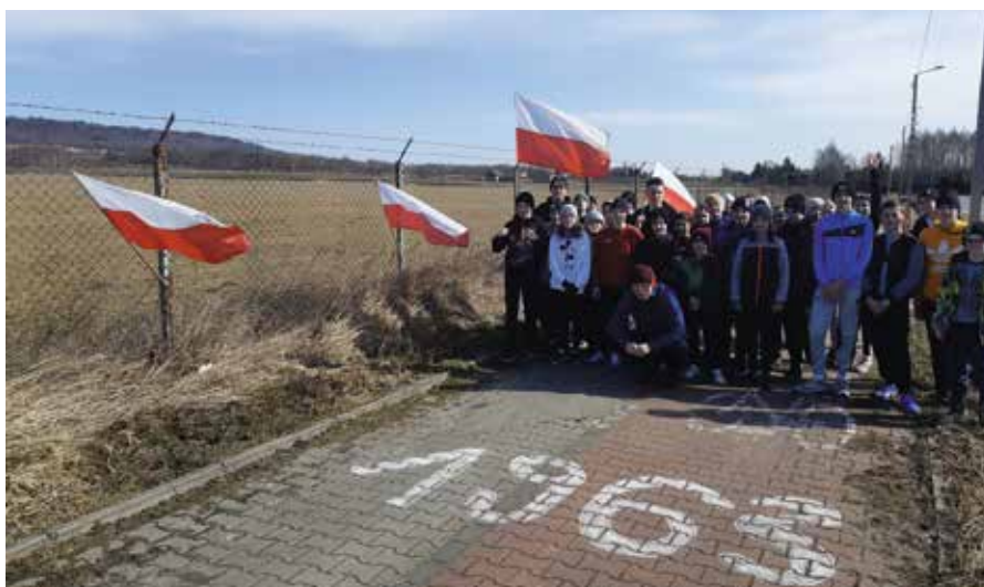
Start trasy zaplanowano wzdłuż małowskiego lotniska.

Obchody Narodowego Dnia Pamięci „Żołnierzy Wyklętych” w Małowie miały szczególny wymiar. Uczniowie przebiegli symboliczną trasę o długości 1963 metry, stanowiącą odwołanie do roku, w którym zginął ostatni poległy w walce Żołnierz Wyklęty. Trasa biegła wzdłuż lotniska.