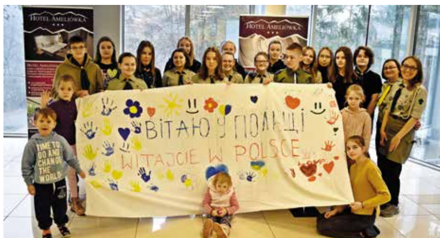
Na zajęcia zaprosili m.in. harcerze z gminy Masłów.

Sytuacja z pomocą dla obywateli Ukrainy przebywających na terenie gminy Masłów została ustabilizowana.