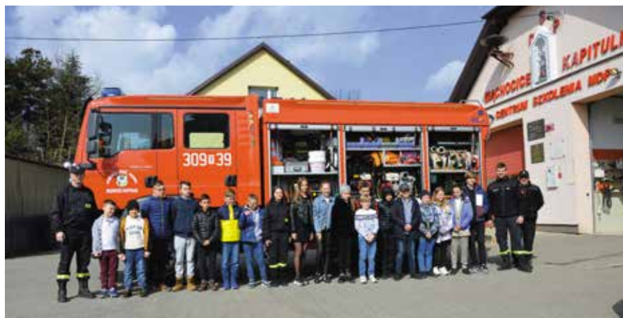
W oczekiwaniu na wyniki uczniowie obejrżeli wnętrze wozu bojowego i jego wyposażenie.

Ogólnopolski Turniej Wiedzy Pożarniczej „Młodzież Zapobiega Pożarom” ma na celu popularyzowanie przepisów i kształtowanie umiejętności w zakresie ochrony ludności, ekologii, ratownictwa i ochrony przeciwpożarowej. W szczególności służy popularyzowaniu wśród dzieci i młodzieży wiedzy ze znajomości przepisów przeciwpożarowych, zasad postępowania na wypadek pożaru, praktycznych umiejętności posługiwania się podręcznym sprzętem gaśniczym, wiedzy na temat techniki pożarniczej, organizacji ochrony przeciwpożarowej, szeroko rozumianego ratownictwa oraz wiedzy z zakresu bezpieczeństwa powszechnego, a także historii i tradycji ruchu strażackiego.