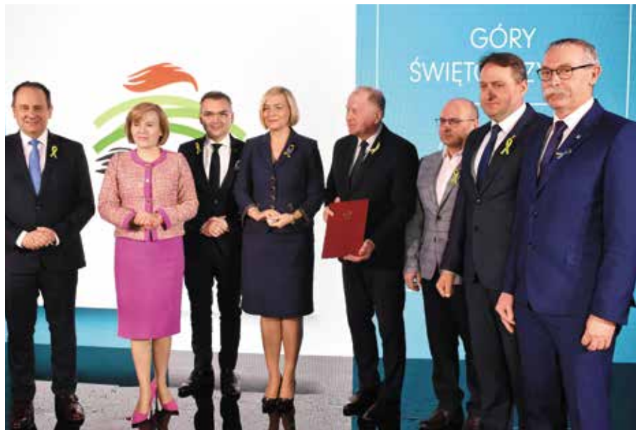
Delegacja Związku Gmin Gór Świętokrzyskich odebrała wyróżnienie.

Góry Świętokrzyskie otrzymały wyróżnienie w ramach Projektu „Polskie Marki Turystyczne”. Uroczyste ogłoszenie laureatów w plebiscyie organizowanym przez Ministerstwo Sportu i Turystyki oraz Polską Organizację Turystyczną odbyło się w Centrum Geoedukacji w Kielcach.