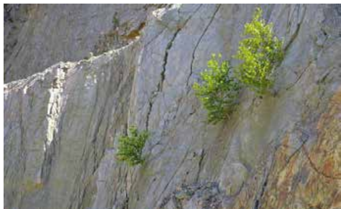
Kierując się poszanowaniem środowiska naturalnego oraz chęcią zbadania wpływu działalności kopalni Wiśniówka na najbliższe otoczenie, Eurovia nawiązała współpracę z Instytutem Dendrologii Polskiej Akademii Nauk.