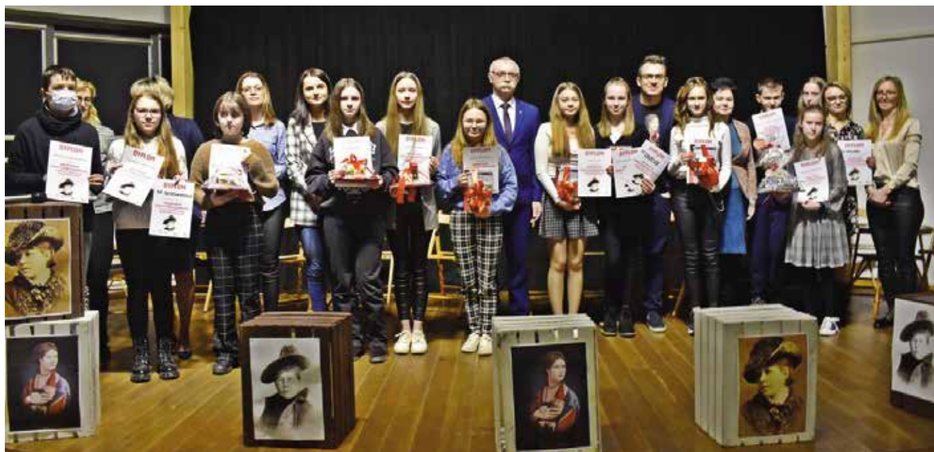
Oni byli najlepsi w Wielkim Teście o Marii Konopnickiej.