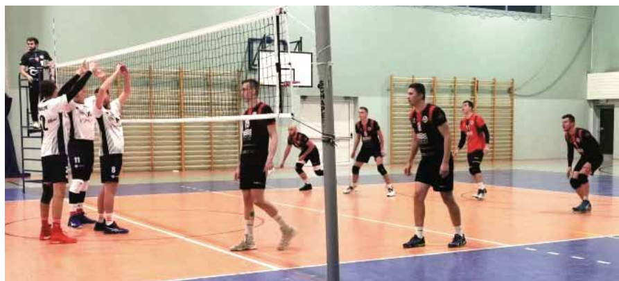
To była udana inauguracja sezonu w hali w Masławie.

Pasmo sukcesów przerwała dopiero porażka z drużyną z Końskich.