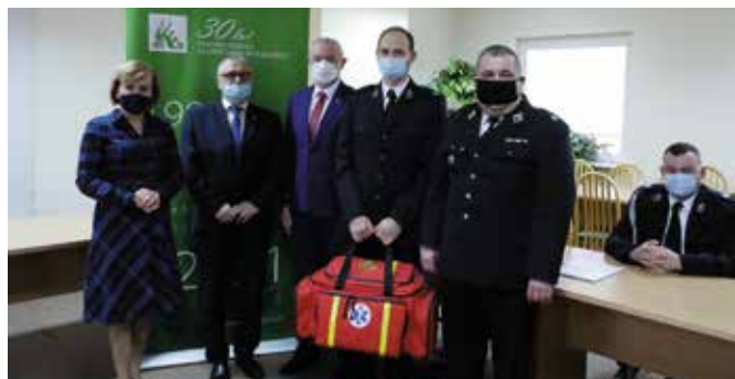
Zestaw ratownictwa przedmedycznego trafił do jednostki OSP Mąchocice Kapitulne.