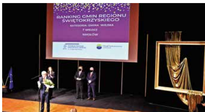
Siódme miejsce dla gminy Masłów w kategorii gmin wiejskich w przeprowadzonym pierwszy raz w historii Rankingu Gmin Regionu Świętokrzyskiego to wspólny sukces społeczności naszej gminy.