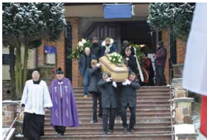
Uroczystości pogrzebowe odbyły się w kościele pw. NMP Królowej świata w Brzezinkach.