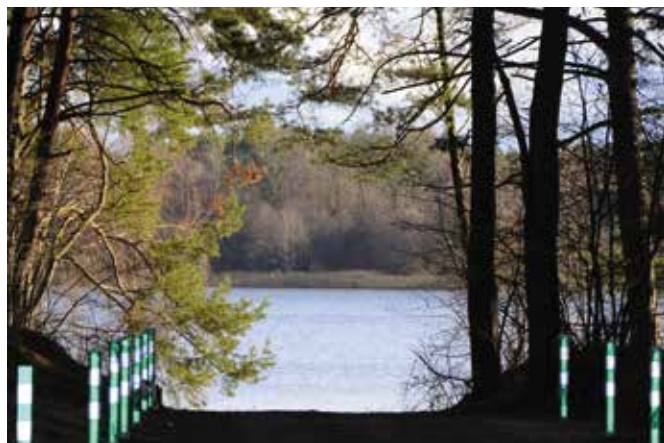
W Woli Kopcowej zbudowano dojazd do zbiornika wodnego.