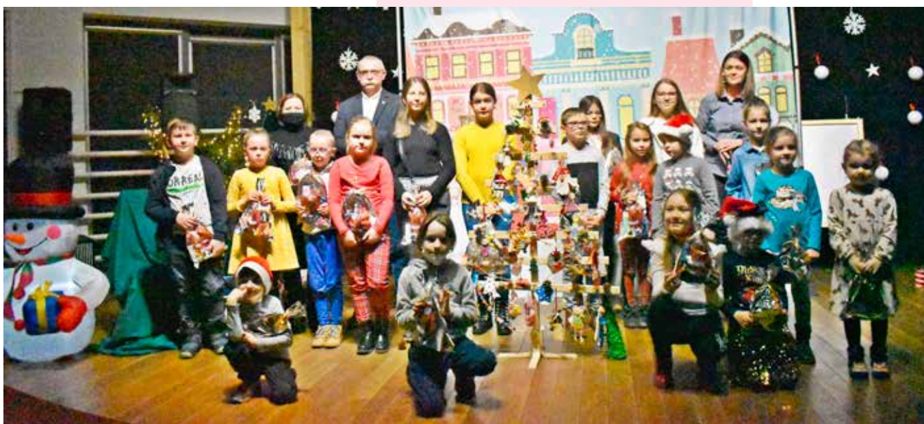
Laureaci konkursu na najpiękniejszą ozdobę z masy solnej Gminnej Biblioteki Publicznej w Małowie.