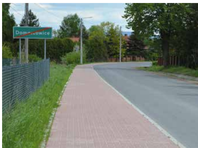
Nowy chodnik powstał pomiędzy Wolą Kopcową a Domaszowicami.

a jezdnia jest poszerzona do 5,5 metrów. Powstały też cztery oznakowane przejścia dla pieszych. Chodnik został zaprojektowany z budżetu gminy Masłów, a projekt przekazany do realizacji Powiatowi Kieleckiemu, który jest właścicielem drogi. Zadanie jest dofinansowane z rządowym wsparciem w wysokości około 50 %. Druga połowa została zapewniona przez Powiat i Gminę po 25 %.