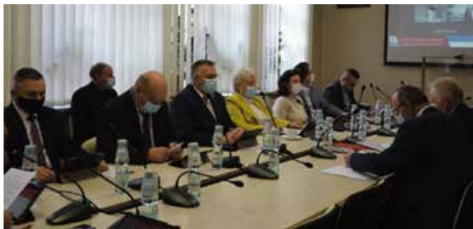
Część radnych obradowała w Urzędzie Gminy....

ze specjalnymi potrzebami edukacyjnymi. Sprawozdanie obejmowało wyjątkowo trudny okres funkcjonowania placówek w czasie pandemii COVID-19, na okres 10 miesięcy pracy szkół aż 7 było czasem pracy zdalnej częściowo lub całkowicie. W szkołach gminy Małków uczyło się 990 uczniów. W szkołach liczba uczniów utrzymywała się na podobnym poziomie jak w latach poprzednich. We wszystkich jednostkach oświatowych były zatrudnione 193 osoby (w tym 125 nauczycieli, pozostałe to pracownicy obsługi, administracji i CUV). Realizowano różnorodne formy zajęć wspierających rozwój uczniów. W 2020 roku przyznano pomoc w kwocie 122 678,46 zł w formie stypendiów i zasiłków szkolnych. Na wsparcie w podnoszeniu swoich kompetencji mogli liczyć również nauczyciele np. w formie dofinansowanych studiów podyplomowych czy szkoleń indywidualnych. Realizowane były prace remontowe m.in. termomodernizacja szkół w Małochocicach-Scholasterii i Brzezinkach. Z egzaminem kończącym naukę najlepiej w gminie poradzili sobie uczniowie szkoły w Małowie. Placówka osiągnęła wyniki powyżej średniej powiatowej, wojewódzkiej i krajowej z matematyki i języka angielskiego.