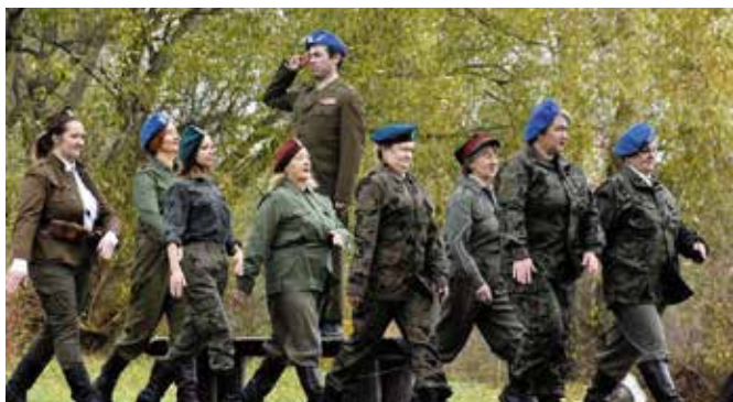
Panie wystąpiły m.in. w wojskowych mundurach.