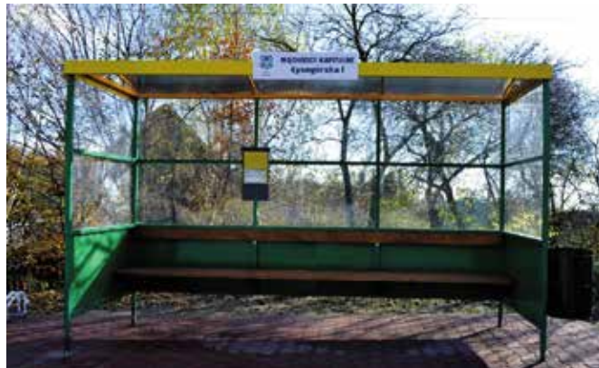
Mąchocice Kapitulne, ul. Łysogórska