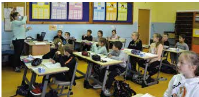
Projektor i uchwyt, które stanowią doposażenie jednej z pracowni masłowskiej szkoły zakupiono w ramach Programu z zakresu edukacji ekologicznej dla uczestników konkursu „Czyste Świętokrzyskie”.

Projektor i uchwyt, które stanowią doposażenie jednej z pracowni masłowskiej szkoły zakupiono w ramach Programu z zakresu edukacji ekologicznej dla uczestników konkursu „Czyste Świętokrzyskie”. Koszt nabytego sprzętu to 4 tys. zł, w 100% sfinansowany ze środków funduszu. Warto zaznaczyć, że w ramach tego konkursu gmina Masłów otrzymała wcześniej 4 800 zł dotacji na likwidację dzikich wysypisk śmieci.