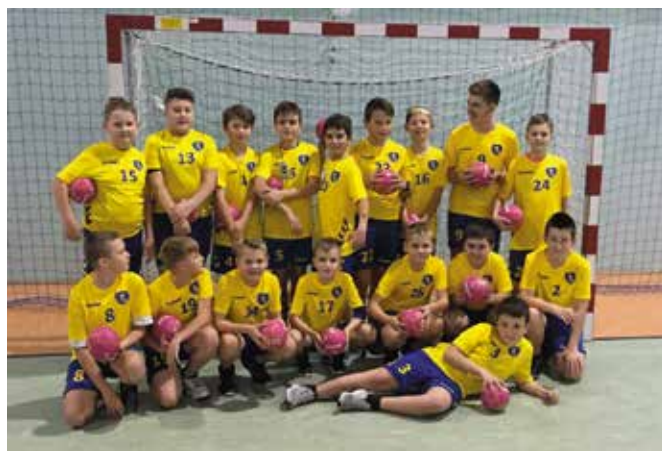
Nasza drużyna „Szóstka Masłów”.

W skład drużyny Masłowskiej wchodzić dzieci z rocznika 2009-2010 i będą w tym sezonie rozgrywać swój pierwszy turniej