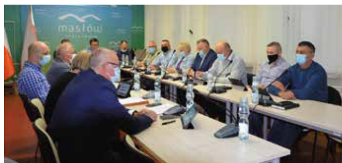
Radni zdecydowali o zwiększeniu limitów finansowych na 2022 r. w ramach zadań wieloletnich, które gmina Masłów realizować będzie z dofinansowań.