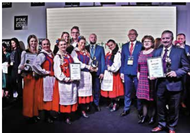
Reprezentacja gminy Masłów na scenie Ptak Expo w Nadarzynie.