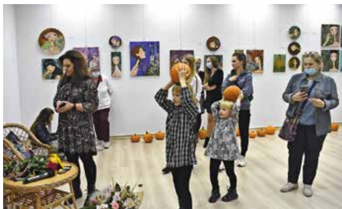
Wystawę oglądali mali i duzi.

Kobiety, które są w większości bohaterkami obrazów występują często ze zwierzętami, artystka nawiązuje sugestywnie do obrazów renesansowych, w których kobiety były często portretowane ze zwierzętami, jak „Dama z łasiczką” Leonarda da Vinci, czy z przedmiotami, takimi jak biżuteria „Dziewczyna z perłą” Jana Vermera. Nie próbuje konkurować z techniką i realizmem przedstawienia postaci. Próbuje jedynie namalować portret psychologiczny, oddać związek portretowanej kobiety z otoczeniem.