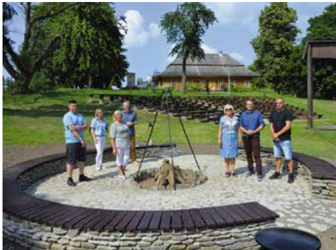
Nowy krąg ogniskowy na Żeromszczyźnie.

Ostatnie miesiące to sfinalizowanie wielu prac potwierdzających fakt, że gmina Masłów inwestuje w rozwój miejsc rekreacyjno-turystycznych. Dzięki projektowi realizowanemu z dofinansowaniem pozyskanym przez Stowarzyszenie Wspólnie dla Tradycji w Masłowie Pierwszym powstała altana turystyczna, a w Ciekotach krąg ogniskowy. W Masłowie Drugim w nowy sprzęt wyposażono plac zabaw, w Brzezinkach, w kompleksie sportowym, powstała siłownia zewnętrzna, a od kilku miesięcy kibice obserwujący rozgrywki na boisku w Woli Kopcowej mogą korzystać z nowych atestowanych siedzisk.