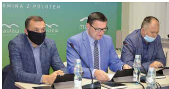
Prezydium Rady Gminy podczas obrad.