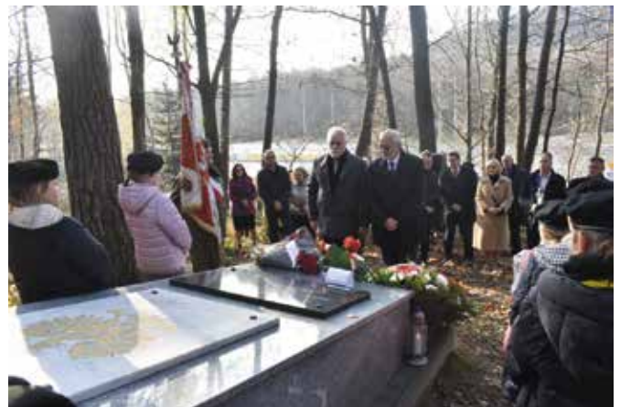
Złożenie kwiatów pod pomnikiem na Białej Górze.