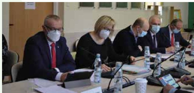
Jak zwykle na sesji wprowadzono zmiany do budżetu oraz Wieloletniej Prognozy Finansowej Gminy Małków na lata 2021 – 2022.

sowując tym samym stawki wynagrodzenia do obecnie obowiązującego rozporządzenia Rady Ministrów z 25.10.2021 r. w sprawie wynagrodzenia pracowników samorządowych zatrudnionych na podstawie wyboru. Obecnie w całym kraju radni każdego szczebla samorządu województwa, powiatu i gminy podejmują uchwały regulujące wynagrodzenia.