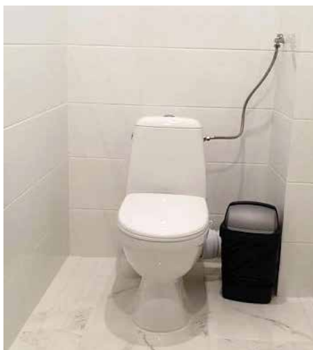
Łazienka przeszła gruntowny remont.