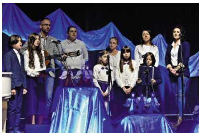
Schola parafii bł. Wincentego Kadłubka w Domaszowicach