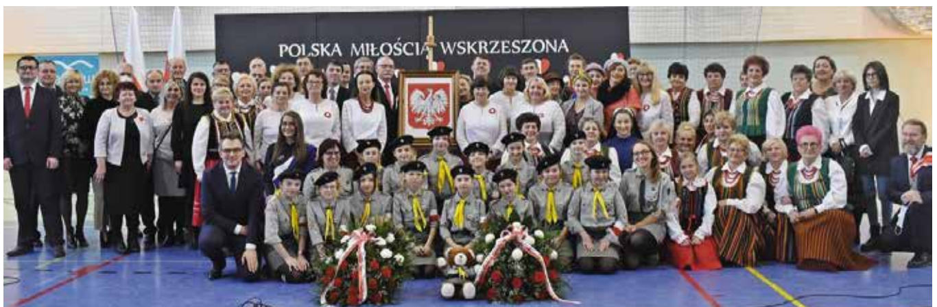
Wykonawcy i goście koncertu na pamiątkowym zdjęciu.