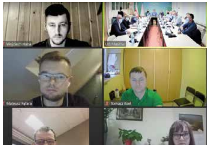
W gronie przyjętych do realizacji inwestycji znalazły się cztery zadania.

W gronie inwestycji znalazły się cztery zadania. Wśród nich wykonanie opasek brukowych przy budynku OSP i świetlicy wiejskiej w Ciekotach wraz z tarasem przy wyjściu z sali spotkań oraz przy garażu wolnostojącym na terenie OSP Ciekoty. Całość inwestycji kosztować będzie 15 500 zł. Kolejnym zadaniem, na które zwiększono środki z budżetu gminy było wykonanie niezbędnych wyburzeń i niwelacji terenu pod budowę boiska do piłki siatkowej – plażowej w Wiśniówce. Oferta przetargowa opiewa na kwotę 27 500 zł. Ostatnim zadaniem, nad którym głosowali radni było wykonanie i montaż furtki wejściowej na teren siłowni zewnętrznej oraz piłkochwytywów na obiekcie boiska sportowego w Brzezinkach za 20 600 zł. Te trzy zadania zostały wybrane przez mieszkańców poszczególnych sołectw w ramach budżetu sołeckiego na 2021 rok.