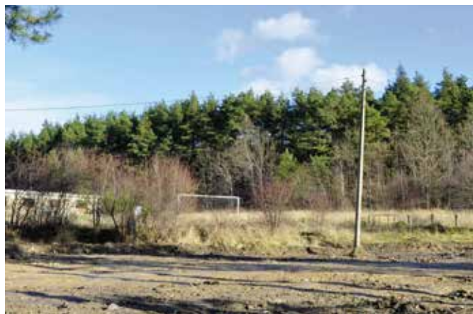
W Wiśniówce przeprowadzone zostały prace ziemne pod budowę boiska