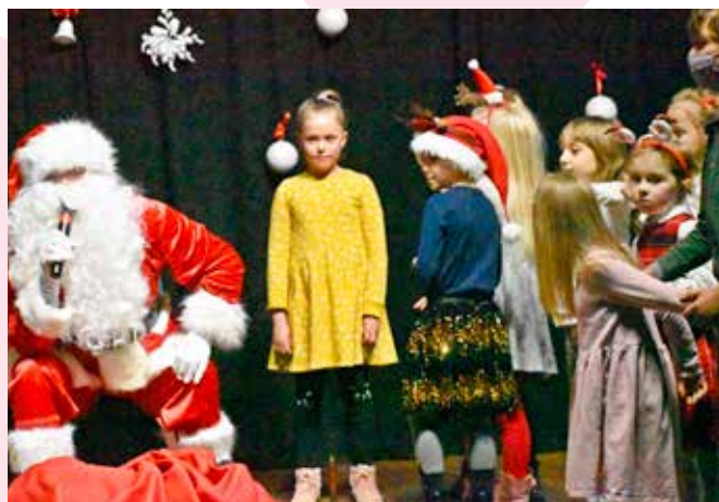
Każde dziecko dostało od Mikołaja słodki upominek.