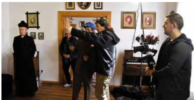
Zdjęcia powstały m.in. w ciekockim dworcu.