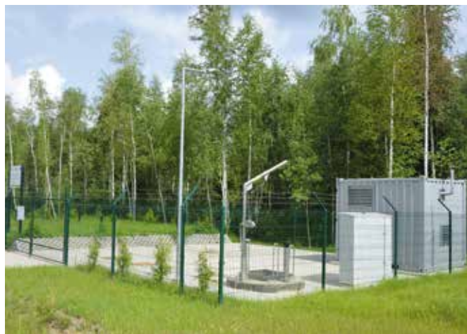
Pompownia w Ciekotach.

W tym roku nie do poznania zmieniła się droga pomiędzy Wolą Kopcową i Domaszowicami. Dzięki inwestycji, której koszt wyniósł niemal 2 mln zł zbudowano chodnik o długości około 1300 m i szerokości 2 m. Na odcinku 150 metrów położony został on dwustronnie mając na celu obsługiwanie przystanku autobusowego. Chodnik całkowicie zmieścił się w pasie drogowym,