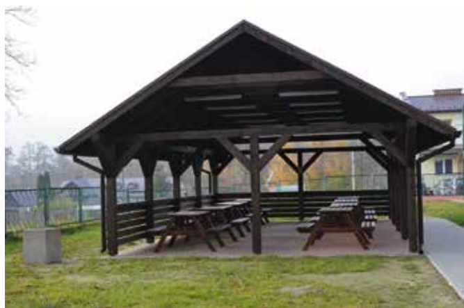
Altana rekreacyjna w Masłowie Pierwszym.

Ważnym elementem zapewniającym spójność na terenie całej gminy były remonty, jakie przeszło 59 przystanków. W sołectwach stanęły nowe wiaty, wszystkie mają nowe tabliczkami z herbem gminy oraz nazwą miejscowości, a część z nich została oklejona mapami oraz zdjęciami prezentującymi najciekawsze miejsca promujące gminę Masłów.