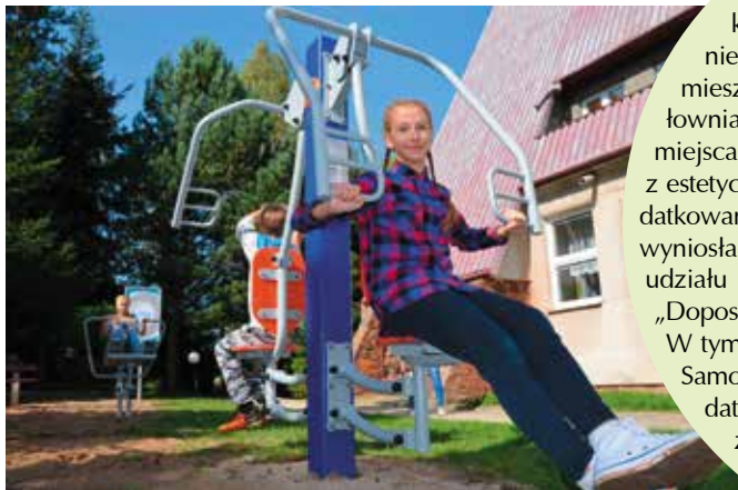
Radość uczniów SP w Mąchocicach-Scholasterii była ogromna, kiedy po raz pierwszy korzystali z nowej siłowni.

Mieszkańcy Masłowa Drugiego wzbogacili się o atrakcyjne miejsce spotkań. Tuż obok placu zabaw zamontowano urządzenia tworzące siłownię napowietrzną. Są to m.in. orbitrek, narciarz, wyciąg górny, krzesiśko, prasa nożna, wahadło, twister i wioślarz.