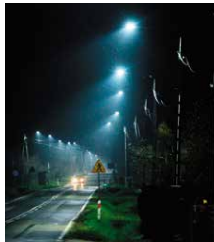
Różnica w oświetleniu jest od razu zauważalna.

Zmiana, jaką już zauważyli mieszkańcy jest znaczna. Lampy będą świecić się przez całą noc, ze względu na ich energooszczędność budżet gminy nie będzie ponosił większych kosztów związanych z oświetleniem niż dotychczas! Do tej pory, oświetlenie uliczne ze względów oszczędnościowych było wyłączane na cztery godziny każdej nocy. Wartość projektu, to ponad 2,3 mln złotych, a unijne dofinansowanie wyniosło niemal 2 mln złotych. To pierwsza inwestycja, jaką Gmina Masłów realizuje w ramach Zintegrowanych Inwestycji Terytorialnych (ZIT) na terenie Kieleckiego Obszaru Funkcjonalnego (KOF) z Regionalnego Programu Operacyjnego Województwa Świętokrzyskiego na lata 2014 – 2020. - Zyskujemy wiele, bo nie tyl-