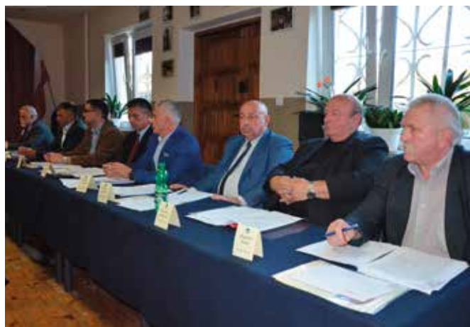
Ważną uchwałą było wsparcie dla Powiatu Kieleckiego. Zostanie ono przeznaczone na budowę chodnika oraz modernizację rowu wzdłuż drogi powiatowej w Woli Kopcowej i Małowie Pierwszym (od pętli autobusowej do drogi 745 przy lotnisku).

niczej i Miodowej. To jednak nie wszystko. Ważną uchwałą było wsparcie dla Powiatu Kieleckiego. Zostanie ono przeznaczone na budowę chodnika oraz modernizację rowu wzdłuż drogi powiatowej w Woli Kopcowej i Małowie Pierwszym (od pętli autobusowej do drogi 745 przy lotnisku). Zadanie zostanie zrealizowane do końca lipca 2018 roku, a przetarg ruszy w październiku tego roku. Tak jak w przypadku powiatowych inwestycji zarówno Gmina Małków jak i Powiat Kielecki zapłacą za nie po połowie.