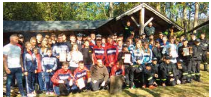
Podczas wielkiego finału spotkali się wszyscy uczestnicy zawodów, organizatorzy i goście.