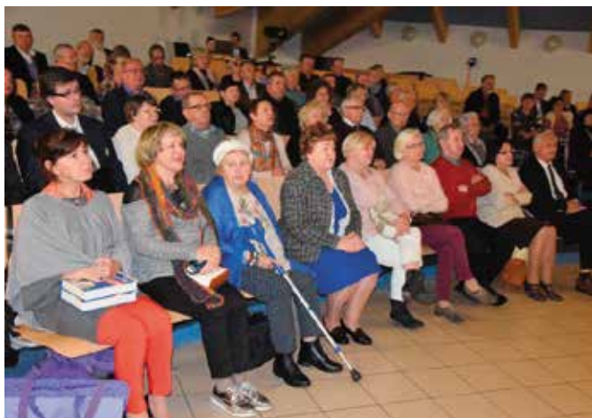
Publiczność w skupieniu wysłuchiwała opowieści pisarki.