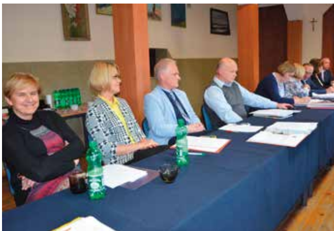
Podjęmowano również uchwały dotyczące edukacji.

W związku z oddaniem do użytku siłowni zewnętrznych uchwałą przyjęto regulamin, na podstawie którego można z nich korzystać. Przypomnijmy, że siłownie zewnętrzne działają w Woli Kopcowej, Dolinie Marczakowej, Wiśniówce, Masłowie Drugim i Mącholicach-Scholasterii. Radni wyrazili zgodę na przekazanie dwóch odcinków sieci wodociągowej w Woli Kopcowej. Zostały wykonane przez prywatnych inwestorów z własnych środków. Po przyjęciu uchwały Gmina Masłów prześle obie sieci do Międzygminnego Związku Wodociągów i Kanalizacji w Kielcach, które będą dbać o ich stan techniczny.