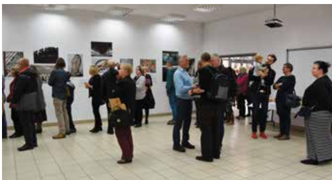
Uroczystość otwarcia ciekawą wystawę nawiązującą do „kwiatków” PRL.