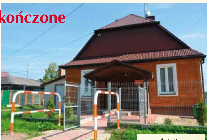
Świetlica po kolejnych pracach.