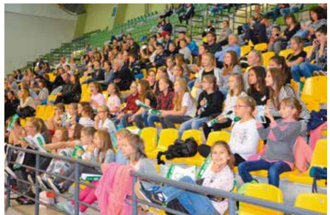
Mecz rozegrano w kieleckiej Hali Legionów.