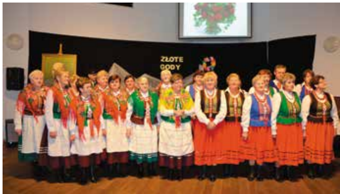
Na scenie zaprezentowały się Kopcowianki i Domaszowianki.