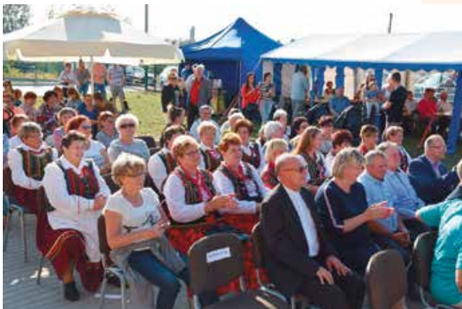
Jak co roku grillowanie przyciągnęło wielu mieszkańców i gości.