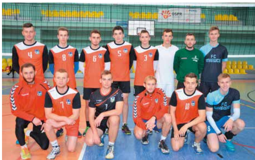
MSS Masłów zwyciężył we wszystkich spotkaniach i wygrał turniej.