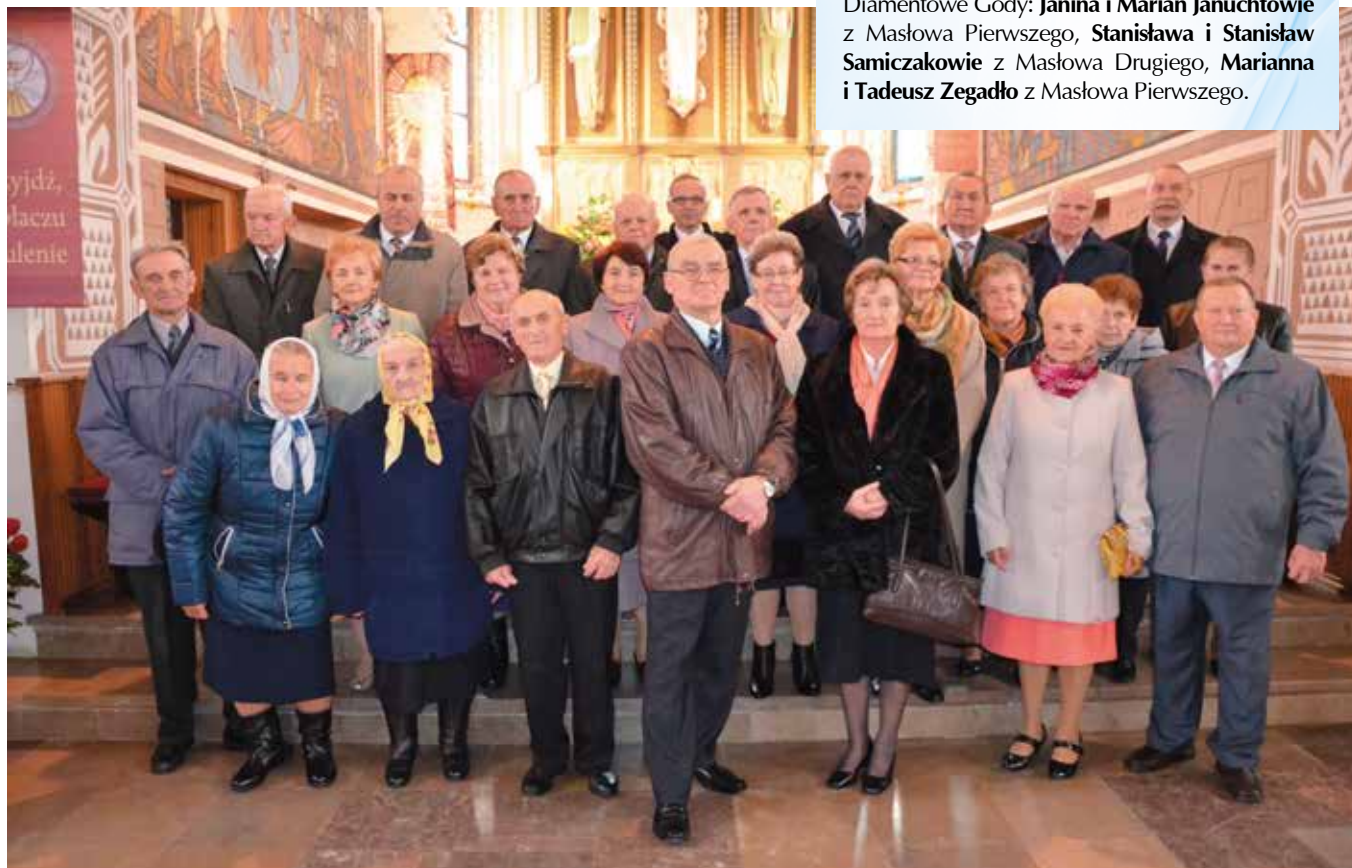
W masłowskim kościele została odprawiona msza w intencji jubilatów.