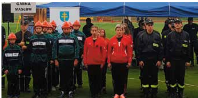
Reprezentacja Gminy Masłów podczas prezentacji.