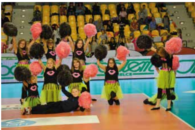
Do doping ugrzewał Tup Tup Dance.