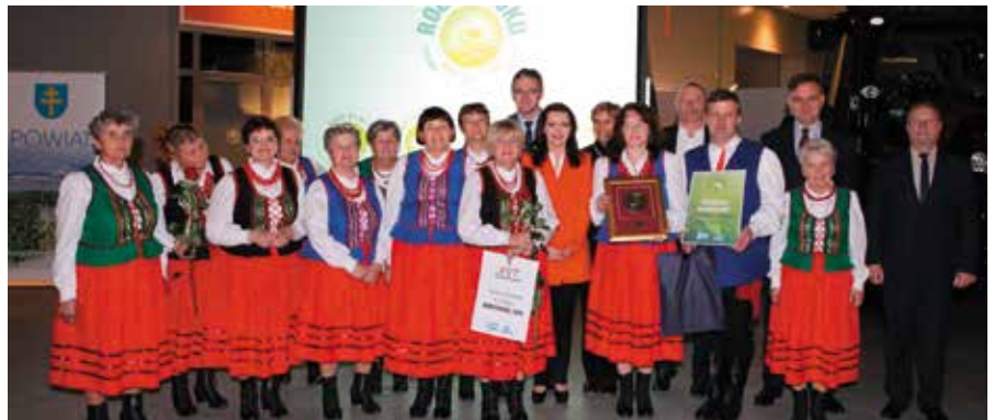
Laureaci konkursów otrzymali nagrody podczas uroczystej gali w Targach Kielce.