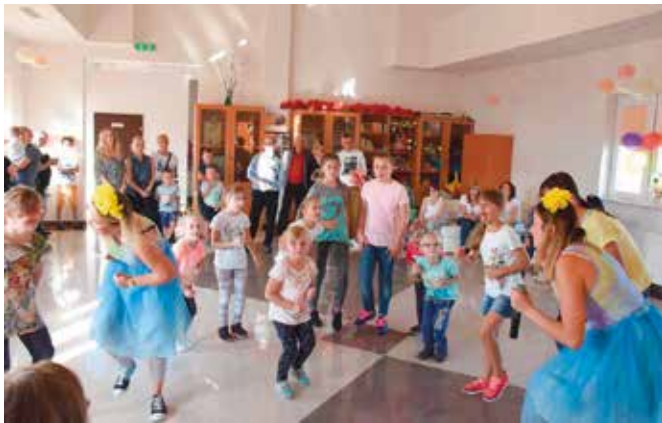
W świetlicy trwały zabawy dla dzieci.

Organizatorzy zadbali o każdy szczegół. Na placu przed świetlicą samorządową stanęła scena, namioty, parasole, a nawet dmuchaniec dla dzieci. Najmłodsi przez cały czas trwania imprezy mogli uczestniczyć w animacjach prowadzonych przez panie z Tęczowej Prywatki. Były ciekawe konkursy i zadania. Na scenie przed