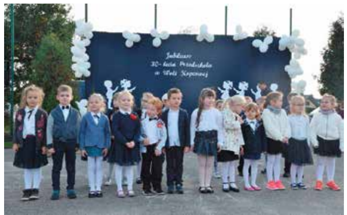
Przedszkolaki zaprezentowały się z jak najlepszej strony.