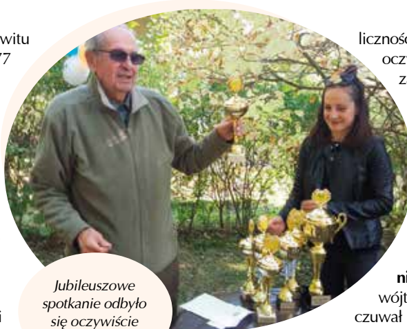
Jubileuszowe spotkanie odbyło się oczywiście w ogrodzie.

Jubileusz 40-lecia działalności Rodzinnego Ogrodu Działkowego „Kopcówka” obchodzono podczas oko-