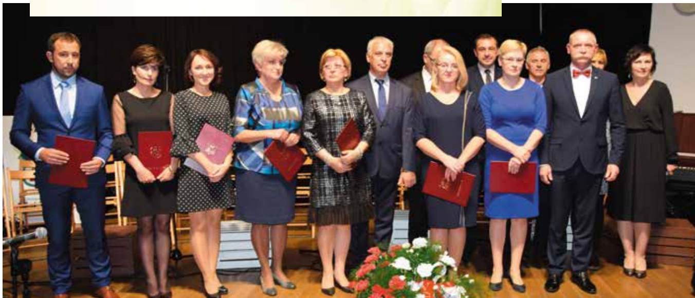
Nagrodzeni nauczyciele pozowali do pamiątkowego zdjęcia.