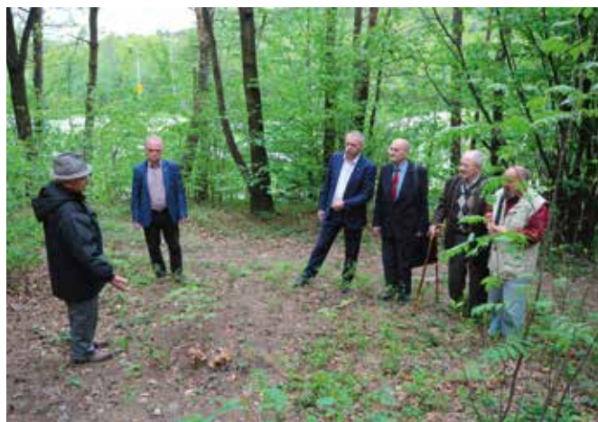
W miejscu, gdzie stanie pomnik odbyło się już pierwsze spotkanie.

Będzie to pierwsze miejsce w gminie Masłów upamiętniające ofiary II wojny światowej w takiej formie. Do tej pory przypomi-