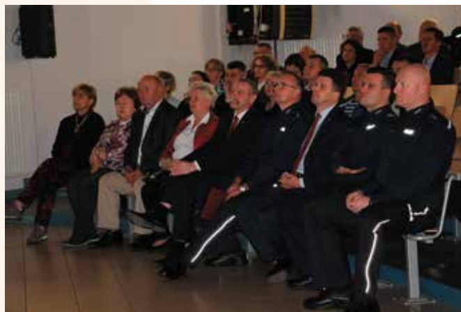
Debata była poświęcona działaniom policji w dwóch gminach: Masłów i Zagnańsk.

Wśród tematów znalazła się efektywność pracy Policji na terenie obu gmin w 2017 roku w porównaniu do analogicznego okresu 2016 roku. W 2016 roku dokonano 120 przestępstw na terenie gminy Masłów. Ich wykrywalność wzrosła i była większa o 20 procent. Wzrosła również liczba interwencji policyjnych na terenie gminy. W bieżącym roku do września było ich 845. Co istotne skrócił się czas dojazdu patrolu na miejsce zdarzenia, który wynosi obecnie ok. 19 minut. Mieszkańcy mogą czuć się bezpieczniej dzięki służbom ponadnormatywnym dofinansowanym