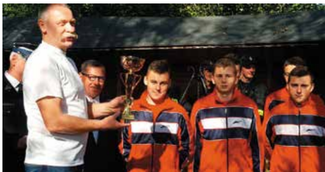
Chłopcy z Młodzieżowej Drużyny Pożarniczej z Brzezinek okazali się najlepszymi.

Turniej Pięciu Strażnic ma piękny cel, ponieważ propaguje zdrowy i aktywny wypoczynek wśród młodzieży i przede wszystkim integruje ją. Podnosi sprawność fizyczną członków drużyn pożarniczych. W ramach turnieju prowadzona jest również edukacja z zakresu ochrony przeciwpożarowej oraz profilaktyki antyalkoholowej, a także edukacja i profilaktyka z zakresu przeciwdziałania uzależnieniom. Młodzież poszerza też swoją wiedzę o gminie Masłowie i regionie. Druhowie od kilku tygodni zmagali się w takich konkurencjach jak: siatkówka, piłka nożna, strong man, musztra, dart. Ostatnia konkurencja, bieg patrolowy zadecydowała o klasyfikacji generalnej, podsumowującej turniej. To nie była łatwa konkurencja, ponieważ wymagała od druhowów dobrej kondycji fizycznej.