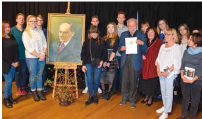
Na spotkanie z profesorem przyjechała młodzież m.in. z IV LO oraz I LO im. Stefana Żeromskiego w Kielcach.