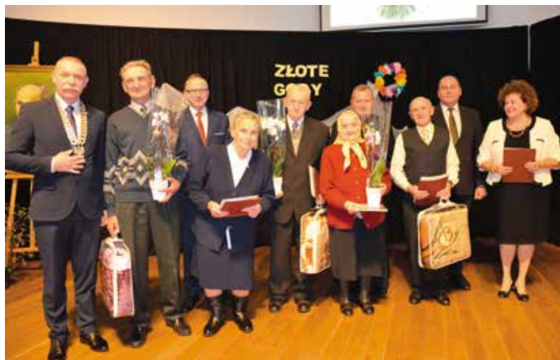
Pary obchodzące Diamentowe Gody.

Po modlitwie jubilaci i goście przejechali do Centrum Edukacyjnego Szklany Dom w Ciekotach, gdzie odbyła się kolejna część