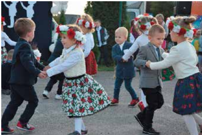
Było bardzo tanecznie i radośnie.