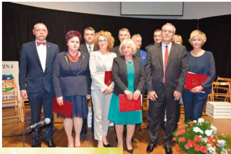
Nagrody tradycyjnie otrzymali również dyrektorzy szkół.