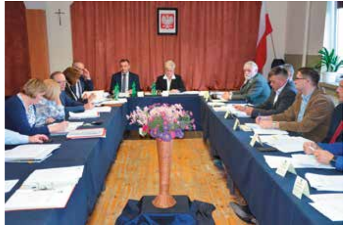
Podczas sesji przyjęto nazwy 13 ulic w Domaszowicach.

Wyrażono zgodę na udzielenie bonifikaty od opłaty rocznej z tytułu trwałego zarządu na rzecz Gminnego Ośrodka Pomocy Społecznej w Masłowie. W programie znalazło się również wydzierżawienie 1m 2 gminnych działek w Woli Kopcowej i Masłowie Pierwszym dla PCK celem ustawienia kontenerów na zbiorke odzieży używanej. Radni zmienili uchwałę Rady Gminy Masłów z dnia 27 września 2012 r. w sprawie podziału gminy Masłów na okręgi wyborcze, ustalenia ich granic i numerów oraz liczby radnych wybieranych w każdym okręgu wyborczym. Jest to związane z uporządkowaniem numeracji oraz nadaniem nazw ulic w Do-